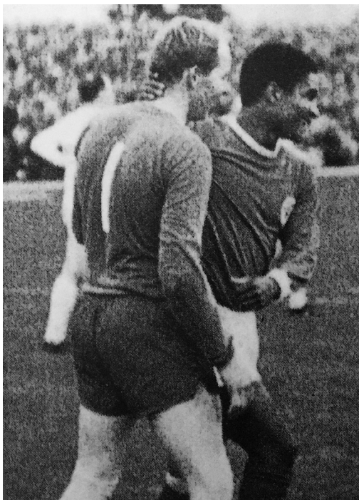
Ein Highlight in der Fußball-Karriere meines Vaters: die Begegnung mit Eusébio im Spiel gegen Benfica Lissabon

Bis das Spiel an diesem Septemberabend um 18.15 Uhr angepfiffen wurde, waren 18309 Zuschauer ins Stadion gepilgert, so viele, wie es Plätze bot, die Stehplätze mit eingerechnet. Für isländische Verhältnisse damals eine fast schon astronomische Zahl. Man darf nicht vergessen, dass in unserem Land nur rund 330000 Menschen leben. Um in Deutschland den gleichen Prozentsatz zu erreichen, müssten etwa viereinhalb Millionen zu einem einzigen Fußballspiel gehen. Obwohl die Zuschauer auf den Rängen des Laugardalsvöllur in den folgenden neunzig Minuten kein einziges Tor zu sehen bekamen, jubelten nach dem Schlusspfiff alle, die gekommen waren.