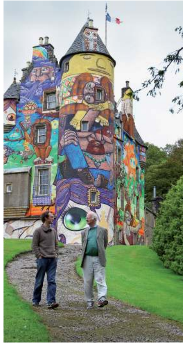
Schon besser! Noch immer graue Haare, aber mit buntem Schloss. Und man geht wieder baggy!