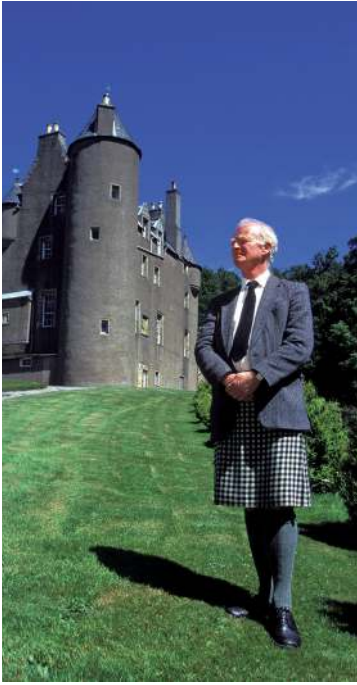
Laaaaaangweilig! Der Graf von Glasgow mit grauem Haar und grauem Schloss im Jahr 1996.