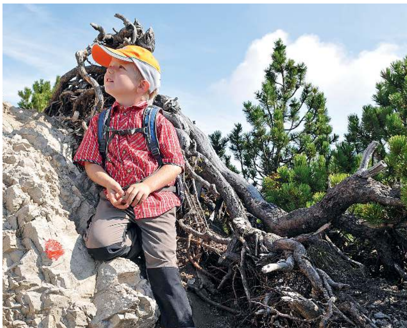
Aufregend: Felsen sorgen für Spannung.

Ein kleiner Gletscher als Kühlmittel für Münchner Bier