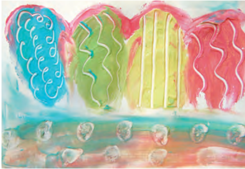
3 Quarkfarben mit Kratzspuren

tragen werden. Vor allem auf buntem Papier leuchtet die gefärbte Quarkfarbe intensiv. Dabei geht es mehr um das sinnliche Vergnügen von Riechen, Sehen und das sanfte Verstreichen der Quarkfarbe (und eventuell auch Schmecken).