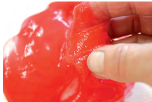
6 Fester, farbiger Kleister

Auch für Menschen mit Sehbehinderung geeignet.