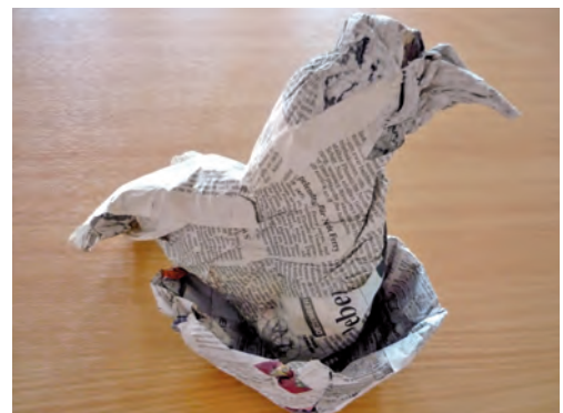
3 Vogel im Nest, Knüllobjekt

Kleinere Plastiken lassen sich aus geknülltem Zeitungspapier formen. Dabei wird mit sehr einfachen, reduzierten Formen ohne Details gearbeitet. So eignet sich diese Technik gut für Menschen mit eingeschränkter Feinmotorik. Einzelheiten können nach dem Trocknen aufgemalt oder geklebt werden.