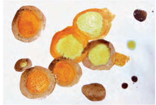
4 Gewürzfarben, Paprika, Kakao, Curry

Gewürze (z. B. Zimt, Kakao, Paprika, Curry, Cayennepfeffer, Kurkuma, schwarzer Pfeffer, Nelke), Sonnenblumenöl, kleines Gefäß, Pinsel, Teelöffel, dickeres Papier