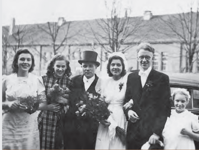
Hochzeit vor dem Fronteinsatz.

Die erste Atombombe wird über Hiroshima abgeworfen. Dadurch zwingen die USA die Japaner zur Kapitulation.