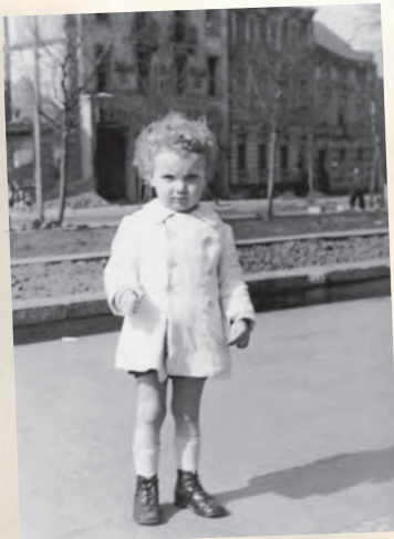
Der Verfasser im Alter von zweieinhalb Jahren vor dem ausgebombten Elternhaus in Duisburg.