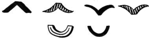
Zirkumflex, Hatschek & Breve