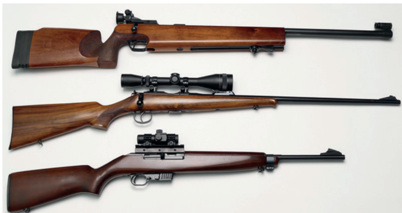
Abbildung 2: Kleinkalibergewehre (alle Kaliber .22 long rifle oder .22 lfb): von oben: 1) Wettkampfbüchse, Fa. Walther für sportliches Schießen auf 50 m (Einzellader) mit sogenannter Diopter-Visierung. 2) Jagdbüchse für Kleinwild, Brünner Waffenwerke, Mod. 2 (Mehrlader) mit Zielfernrohr. 3) Selbstladebüchse, Erma EGMI, Mod. 70 mit Rotpunktvisier.