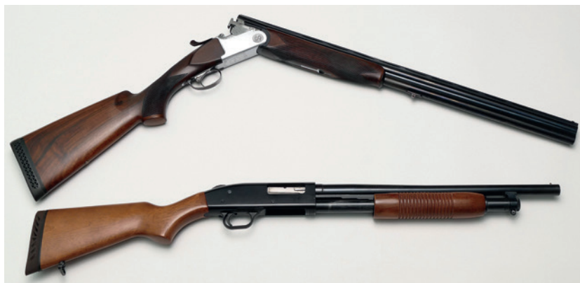
Abbildung 3: von oben: 1) Bockflinte mit geöffnetem Verschluss, Fabrikat Rottweil, Kaliber 12/70. 2) Vorderschaft-Repetierflinte (Pumpflinte), Fabrikat Mossberg, Kaliber 12/76.

aufgebockt – daher die Namensgebung. Man spricht von Bockwaffen, wenn die Läufe übereinander angeordnet sind, also auch bei Büchsen oder kombinierten Jagdwaffen mit Büchsen- und Schrottläufen. Die Namensgebung hat also mit dem Schuss auf den Rehbock nichts zu tun! Bei Flinten, deren Läufe nebeneinander angeordnet sind, spricht man von Querflinten oder Doppelflinten .