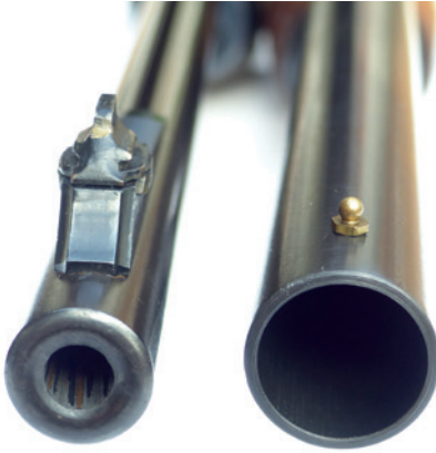
Abbildung 8: Laufmündung links: Büchsenlauf („gezogener“ Lauf erkennbar); Laufmündung rechts: Schrotlauf (glatter Lauf).

Die doppelläufige Bockflinte ist waffenrechtlich als Einzelladerwaffe einzuordnen . Sie kann zum Wurfscheibenschießen von einem 18-jährigen Schützen mit waffenrechtlicher Erlaubnis erworben werden.