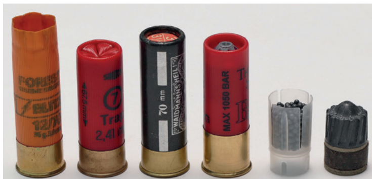
Abbildung 7: Schrotpatronen – v.l.n.r.: abgeschossene Patronen (erkennbar die offene Börde-lung). Patronen mit der Angabe der Hülsenlänge 67,5 mm und 70 mm. Patronen mit Flinten-laufgeschoss und max. Gasdruckangabe. Schrote mit Schrotbeutel aus Plastik (damit wird eine Berührung der Schrote mit dem Lauf vermieden, somit keine Verformung der Schrote, bessere Abdichtung im Lauf und auch gleichmäßigere Streuung der Schrote). Flintenlaufgeschoss Kal. 12 (Fabrikat Brenneke).