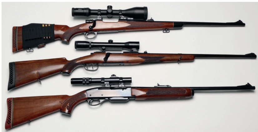
Abbildung 1: Jagdgewehre von oben: 1) Repetierbüchse, System Mauser 98, Kal. .308 Win., Repetiergewehr. 2) Repetierbüchse, System Mannlicher-Schönauer Mod. GK, Kal. 7 x 64. 3) Selbstladebüchse, Gasdrucklader Mod. Remington 742, Kal. .308 Win.