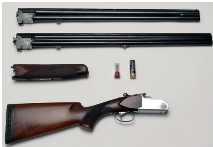
Abbildung 6: Jagdlich und sportlich genutzte Bockflinte (mit Skeet-Austauschlauf) in für Transport und Reinigung zerlegtem Zustand. Deutliche Gebrauchsspuren sind erkennbar – mit der Flinte wurden aber auch mehrere tausend Schuss abgegeben! Der Verschluss selbst zeigt keinerlei Verschleißerscheinungen und schließt noch vollkommen „dicht“. Über dem sogenannten Hinterschaft mit Verschluss und Abzugseinrichtung liegt der sogenannte Vorderschaft, rechts daneben eine Pufferpatrone, die dem schonenden „Abschlagen“ dient, und eine Jagdpatrone.