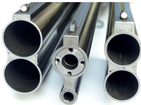
Abbildung 4: Mündungen einer Bockflinte (rechts und links – deutlich erkennbar – die glatten Läufe Kaliber 12; der linke Lauf hat eine sogenannte Skeet-Bohrung für kurze Schussentfernungen, der rechte Lauf hat Choke-Bohrungen ½ und 1/1 für jagdliche Entfernungen). Bei dem mittleren Lauf handelt es sich um die Mündungsansicht einer sogenannten Bockbüchsenflinte im Kal. 16/70 und .222 Rem. mit der Besonderheit, dass in den Schrotlauf ein mündungslanger Einstecklauf im Kal. .30–30 Win. eingelegt ist. Dieser kann an der Mündung mit vier Schrauben eingestellt werden, sodass er mit dem unteren Kugellauf „zusammenschießt“.