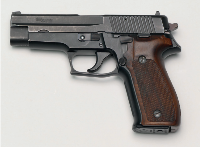
Abbildung 9: Selbstladepistole SIG-Sauer, Modell 226, Kaliber 9 mm Luger – eine der zuverlässigsten Selbstladepistolen. Die Waffe hat deutliche Gebrauchsspuren vom Schießen und Führen – mit dieser Waffe wurden auch mehrere tausend Schuss abgegeben, ohne jegliche Störung.