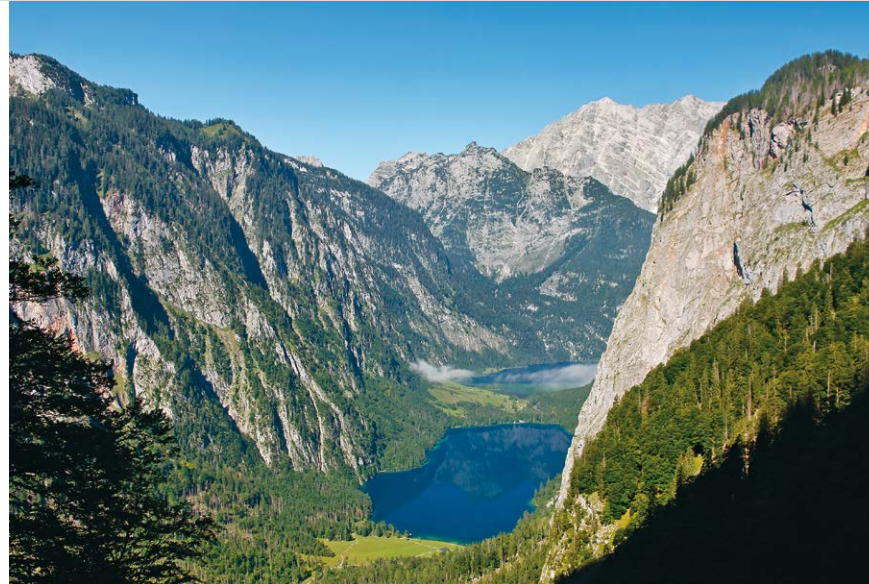
Prachtblick in die Furche mit Obersee und Königssee; dahinter der Watzmann.

Unten: Im Steinernen Meer umgibt uns eine außerordentlich charismatische Landschaft.