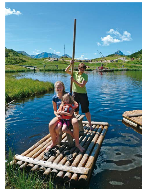
Kinder dürfen nur mit (bereitstehender) Schwimmweste auf das Floß.