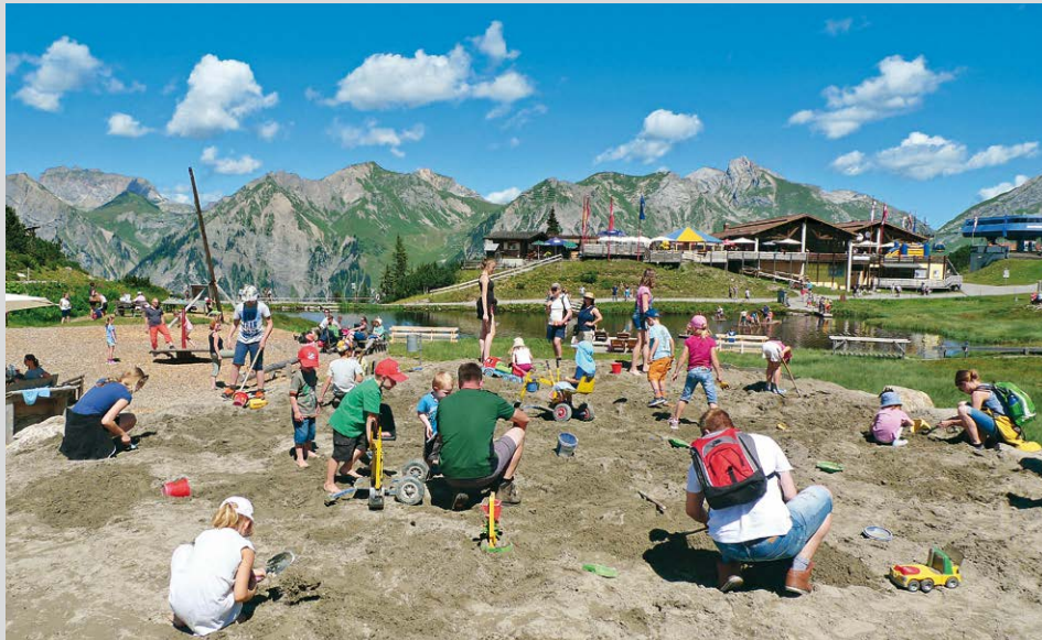
Auf dem Schürffeld kann man mit etwas Glück und Ausdauer kleine silberne Metallbären ausgraben.