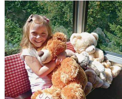
Zum Knuddeln: In jeder zweiten Gondel wartet eine Bärenfamilie.

An der Bergstation der Sonnenkopfbahn wartet auf Familien mit dem liebevoll gestalteten Bärenland mit seinen 30 Stationen eine schöne Attraktion (siehe Hallo-Kinder-Kasten) vor der herrlichen Bergkulisse des Lechquellengebirges mit der Unteren Wildgrubenspitze und der markanten Roten Wand. Im Jahr 2015 wurde das Bärenland von den Nutzern eines Freizeitportals sogar als schönster Spielplatz Vorarlbergs ausgezeichnet. Der Ausflug lässt sich bestens mit einer kurzen, bereits für Kinder ab 4 Jahren geeigneten Wanderung zur bewirtschafteten Oberen Wasserstubenalpe verbinden. Dort kann man in wenigen Minuten über die Weide zu dem wildromantischen Portschabach hinuntersteigen und herrlich am Ufer sitzen und picknicken, während die größeren Kinder sich am und im Wasser vergnügen.