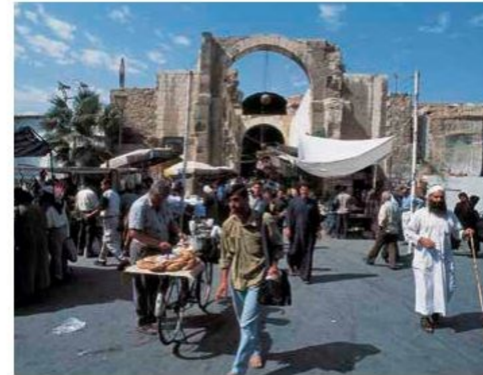
Oben: Wer von der Umayyaden-Moschee kommt, betritt den Suq al-Hamiye durch den Propylon des ehemaligen römischen Jupitertempels, wo heute Händler Souvenirs und religiöse Bücher verkaufen.

Bomben an der Umayyaden-Moschee, Bab Tuma und vor allem der Zitadelle hat man unverzüglich repariert, wichtige Objekte in Sicherheit gebracht.)