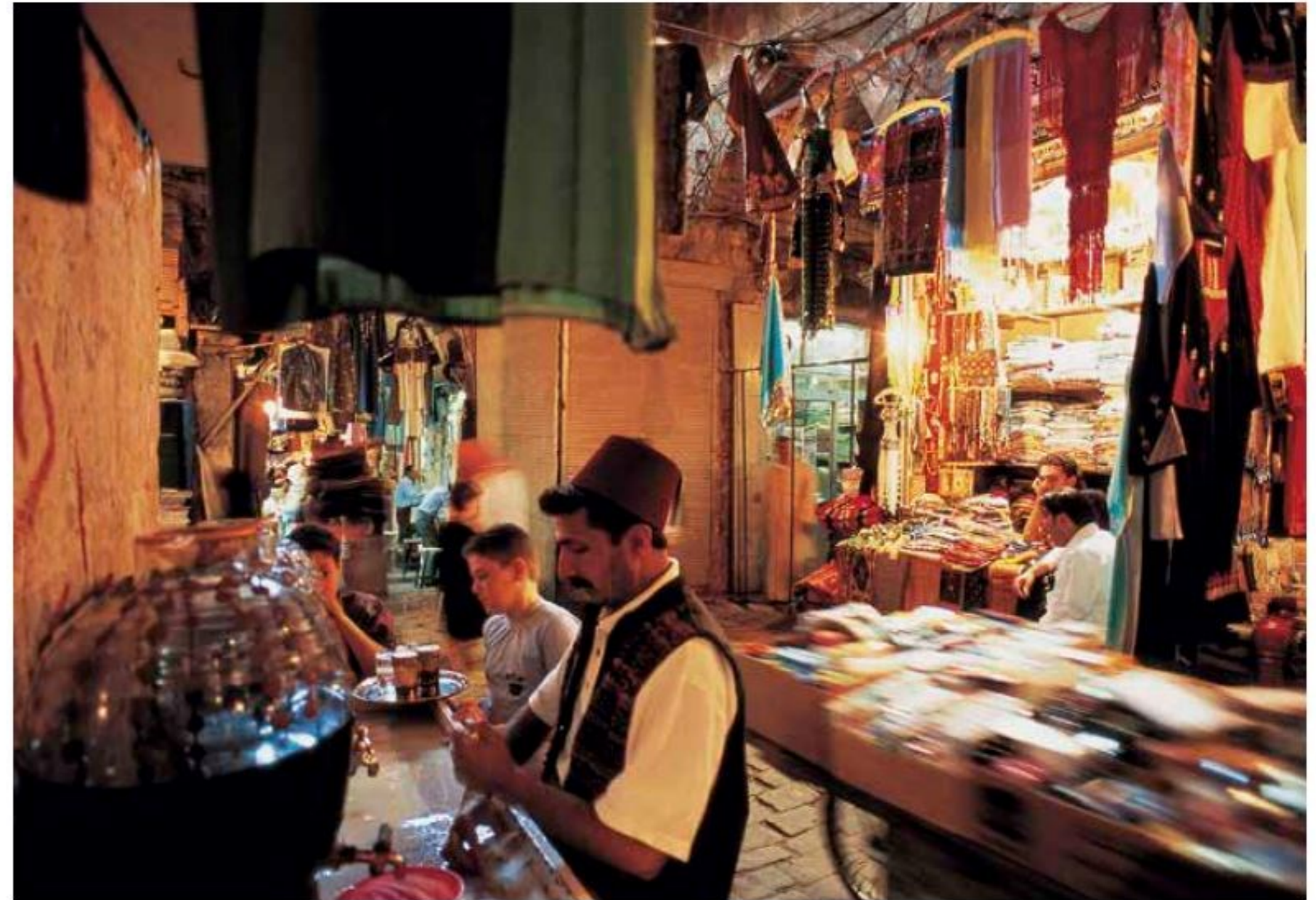
Auch für das leibliche Wohl ist im Suq gesorgt: In Damaskus beherbergt er nicht nur so berühmte Restaurants wie das Abu al-'Izz, sondern auch schlichte Teestuben wie diese.