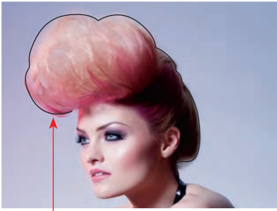
die Frisurenform shape of hairstyle