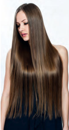
die Haarlänge length of the hair