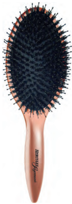
die Bürste hair brush