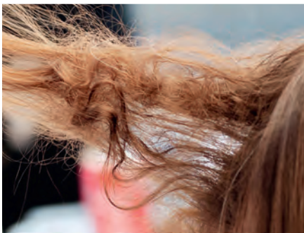
die Klette/ verklettet tangle/tangled