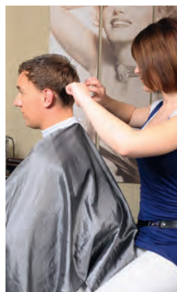
der Nachschnitt trim