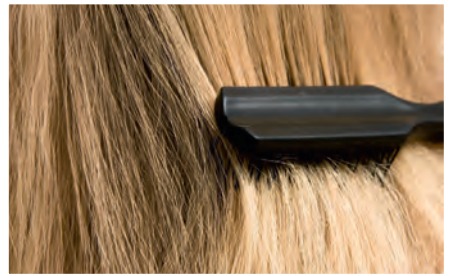
Haare durchbürsten to brush the hair