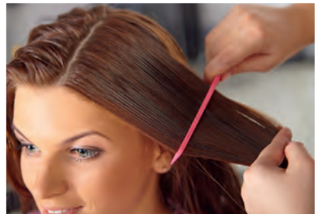
Haare durchkämmen to comb the hair