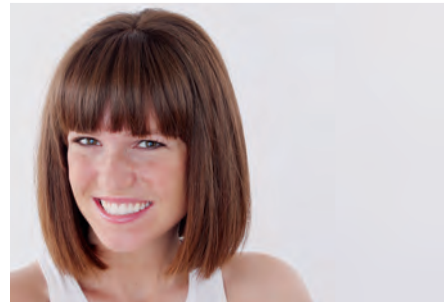
das schulterlange Haar/ schulterlang shoulder length hair/shoulder length