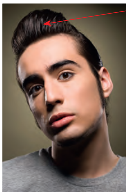
die Tolle ohne Scheitel quiff without a parting