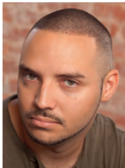
der sehr kurze Maschinen- haarschnitt buzz cut