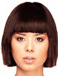
das kinnlange Haar/ kinnlang chin length hair/chin length