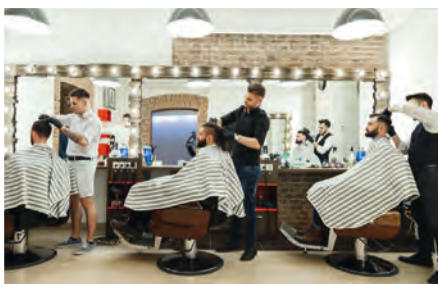
der Herrenfriseur barber/barbershop