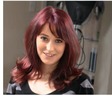
Gesichtsform positiv unterstreichen 👍 to complement the face shape