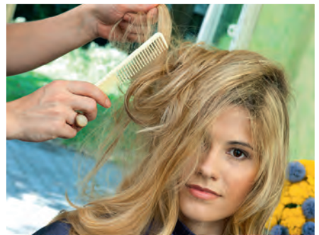
Haare entwirren to detangle hair