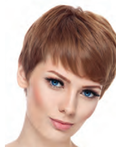
das kurze Haar/ kurz short hair/short