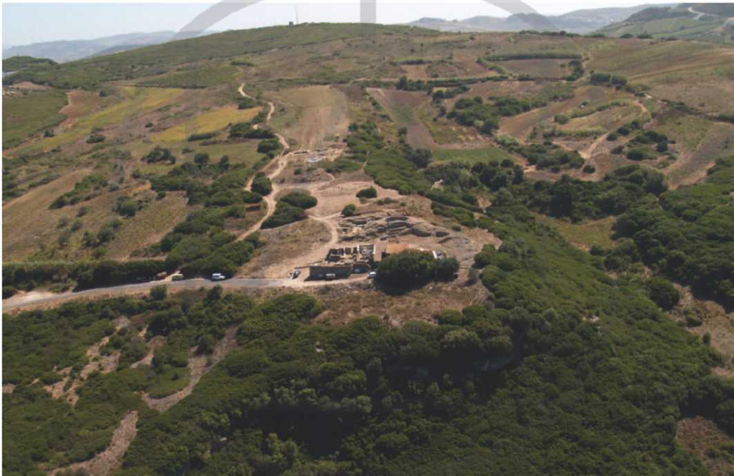
Abb. 1 Luftbild von Zambujal am 21.8.2007, Blick von Westen nach Osten auf den Bergsporn des Cabeço da Calvina, mit den kupferzeitlichen Befestigungsmauern und davor dem Bauernhaus »Casal do Zambujal«, davor der bewachsene Steilabfall in das Tal der Ribeira de Pedrulhos. Im oberen Bereich »Parafujo« sieht man noch die ehemaligen, teilweise von Hecken begrenzten Felder und auf der höchsten Stelle des Cabeço da Calvina zeichnet sich die Silhouette der ehemaligen Windmühle von Parafujo ab.

Zambujal ist eine befestigte Siedlung des 3. und frühen 2. Jts. v. Chr. (Abb. 1) und liegt im Küstengebiet der portugiesischen Estremadura, im Landkreis (»concelho«) von Torres Vedras (Distrikt Lissabon) (Abb. 2). Seit 1964 unternimmt das Deutsche Archäologische Institut, Abteilung Madrid, Ausgrabungen in dieser Siedlung, zu deren 50-Jahr-Feier im Museum von Torres Vedras seit dem 27. Mai 2016 eine große Ausstellung über den derzeitigen Forschungsstand zu sehen ist. Bei der Eröffnungsfeier im Kreuzgang des ehemaligen Augustinerklosters