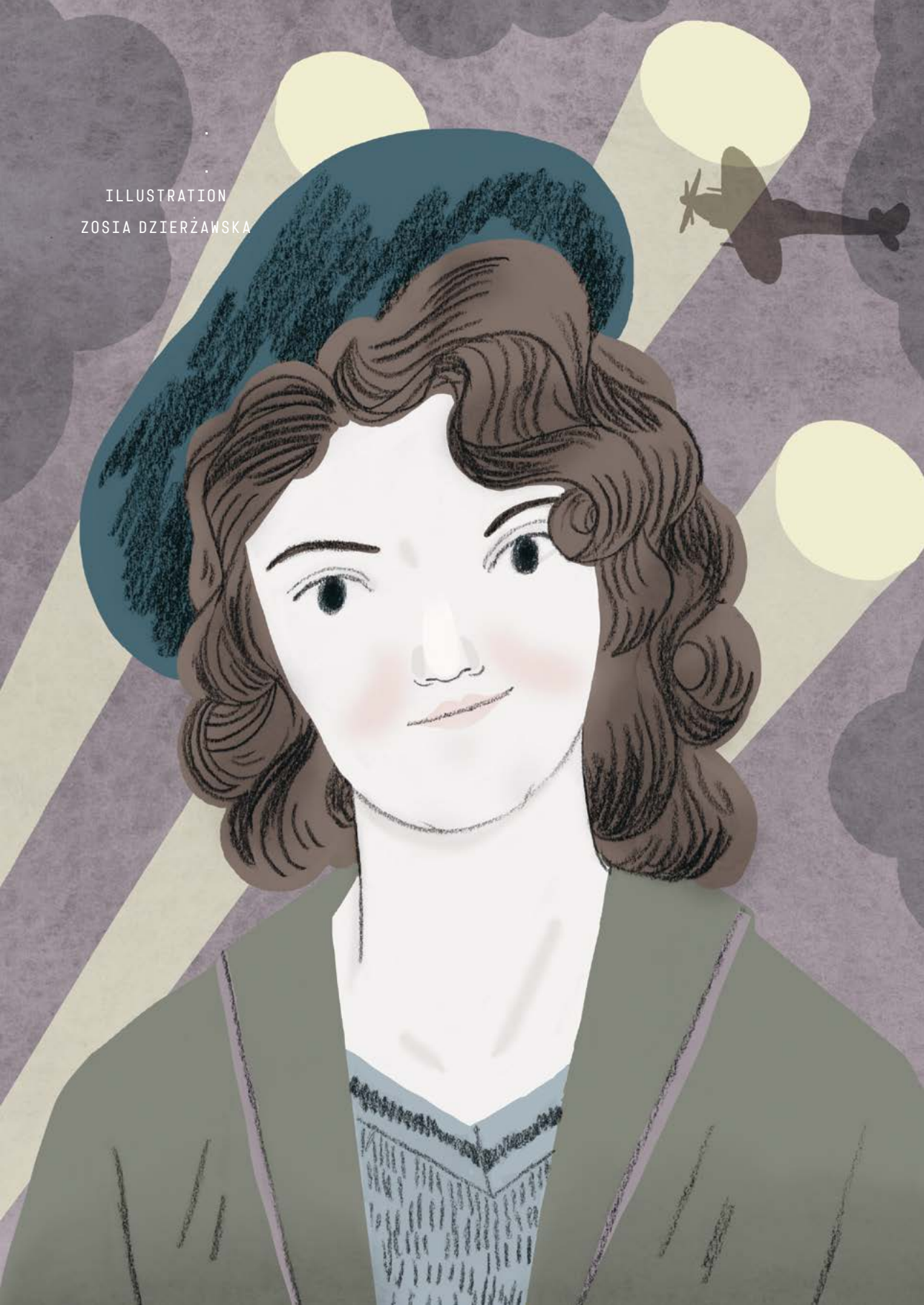
ILLUSTRATION ZOSIA DZIERŻAWSKA