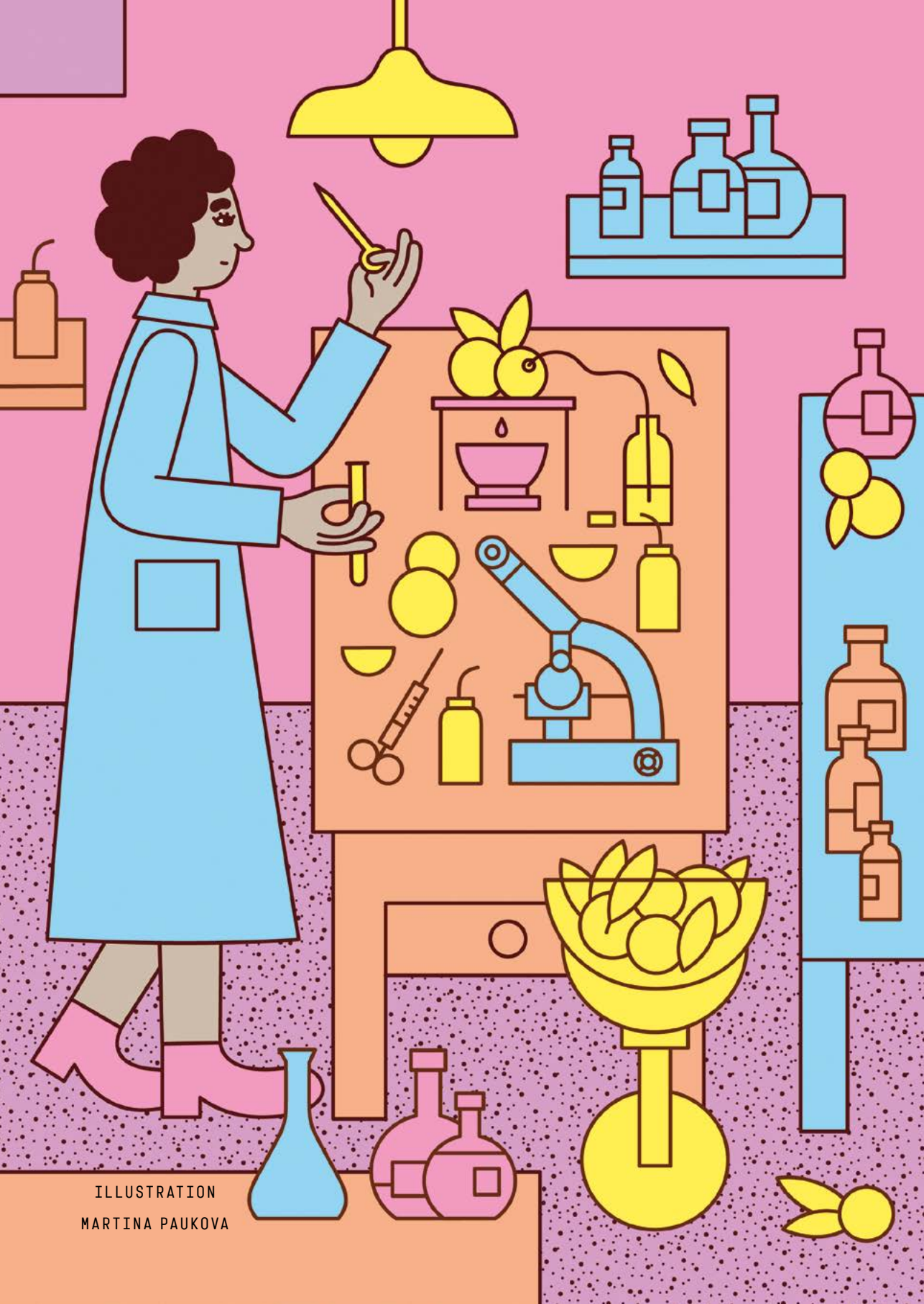
ILLUSTRATION MARTINA PAUKOVA