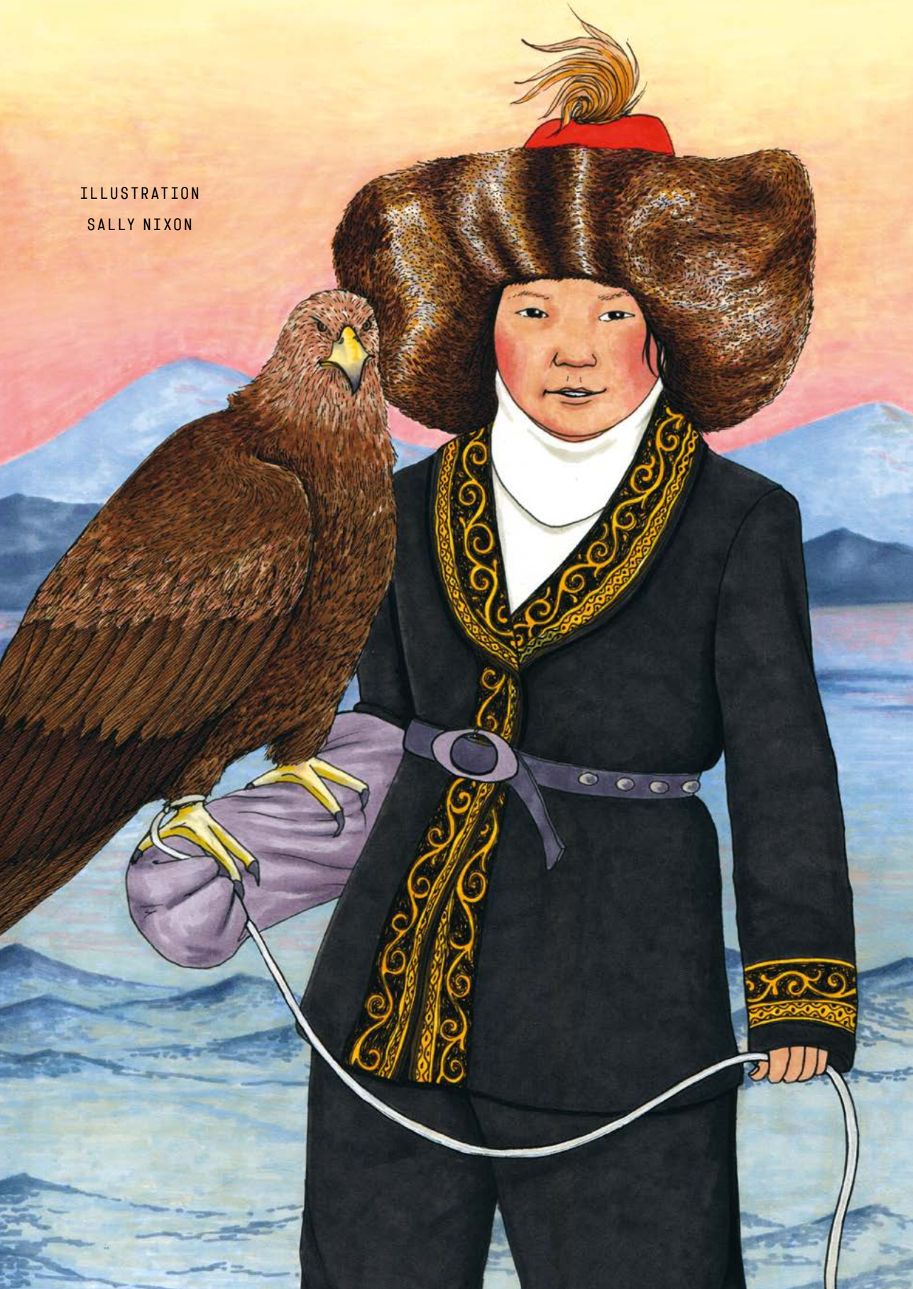
ILLUSTRATION SALLY NIXON