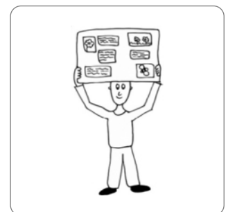
Abb. 14: Piktogramme zur Visualisierung von Arbeitsaufträgen