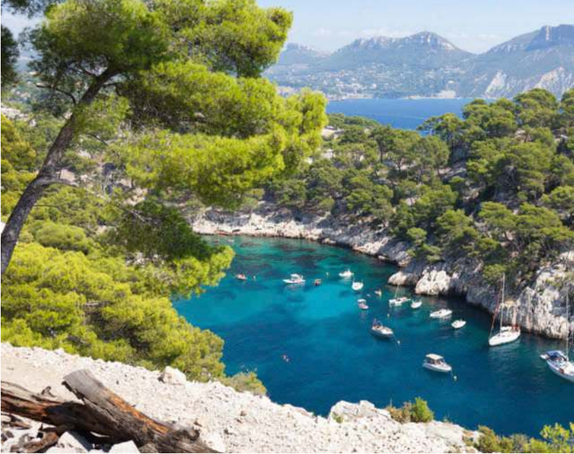
Perfekt zum Segeln, Schnorcheln und Schwimmen: Calanque de Port-Pin bei Cassis

Die Region im Südosten Frankreichs ist ein Landstrich zum Träumen – und wesentlich vielfältiger als gemeinhin bekannt