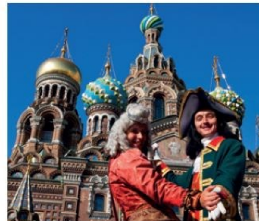
Oben: Sankt Petersburg. Ein Paar, kostümiert als Katharina die Große und Peter der Große posieren vor der Blutskirche.

Marineschule, die Admiralität und Paläste in Planung, im Bau oder bereits fertiggestellt. Auf dem Festungsareal entstand zwischen 1712 und 1733 die Peter-Pauls-Kathedrale, mit ihrem 122,5 Meter hohen spitzen Turm bis heute eines der markantesten Wahrzeichen der Stadt. Die Kirche ist sehr prunkvoll ausgestattet und dient als Grablage der Zaren der Romanow-Dynastie. Am anderen Newa-Ufer wurde ab 1711 der erste Palast für den Zaren errichtet, an dessen Stelle bereits 1721 ein neues Schloss stand. 1754 bis 1762 wurde hier das Winterpalais gebaut, das in den kommenden hundert Jahren durch zahlreiche Erweiterungen namhafter europäischer Architekten zum Hauptwerk des russischen Barock mit all seiner Größe, Pracht und Eleganz avancierte. So entstand bis 1864 der Schlosskomplex mit dem Winterpalais, mit der Großen und Kleinen Eremitage und dem Eremitage-Theater, auf der Stadtseite perfekt abgeschlossen durch den Schlossplatz mit der Alexanderssäule in der Mitte und dem gewaltigen Komplex des Generalstabsgebäudes gegenüber. Auf der Newaseite besticht die 500 Meter