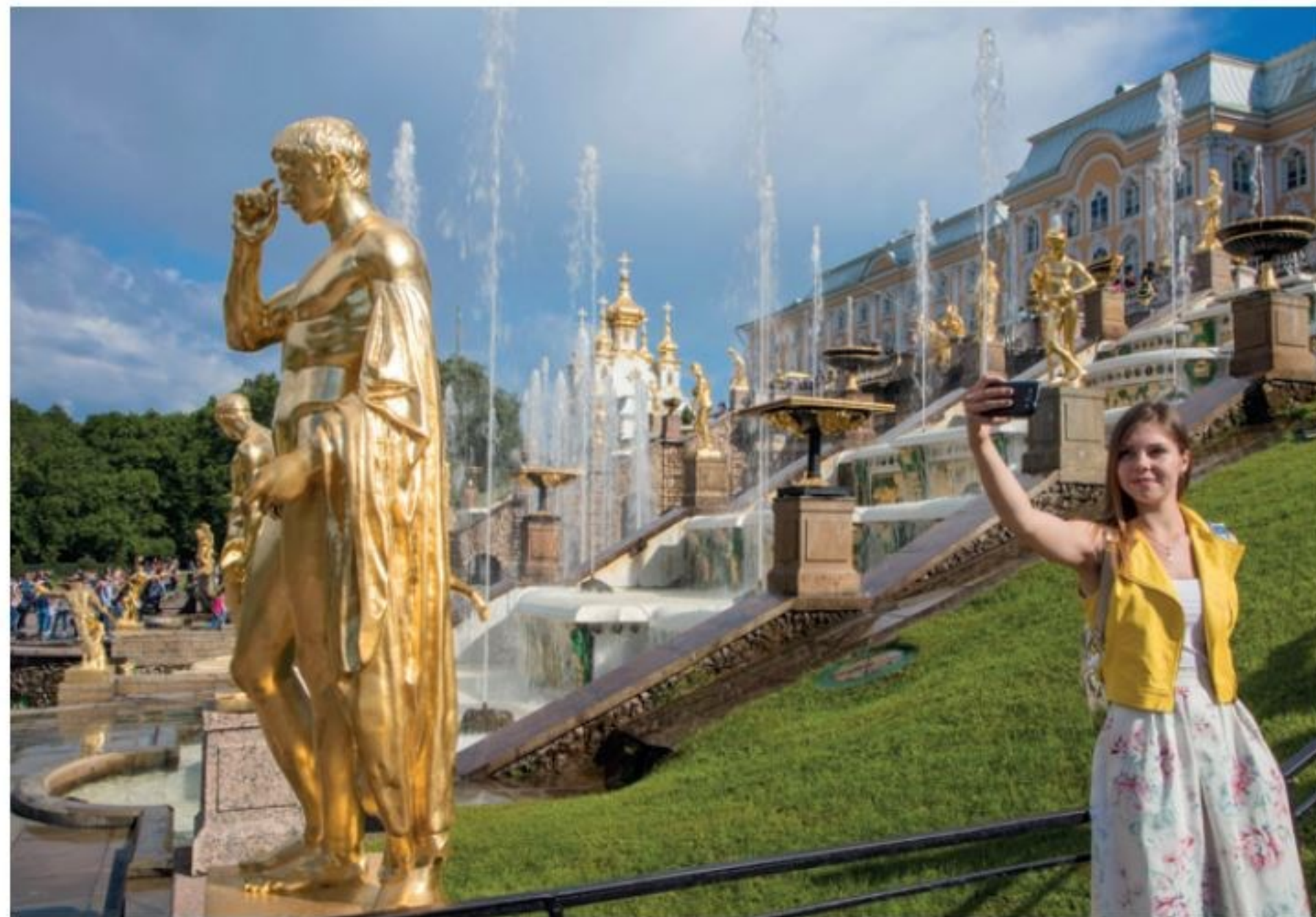
Linke Seite: Blick von der Terrasse der Sommerresidenz Peterhof bei Sankt Petersburg über die Große Kaskade. Mit ihren zahlreichen Fontänen, Skulpturen und Wasserspielen ist sie über einen Kanal mit der Ostsee verbunden. Über ihn werden die Wasserspiele ständig mit Wasser versorgt.