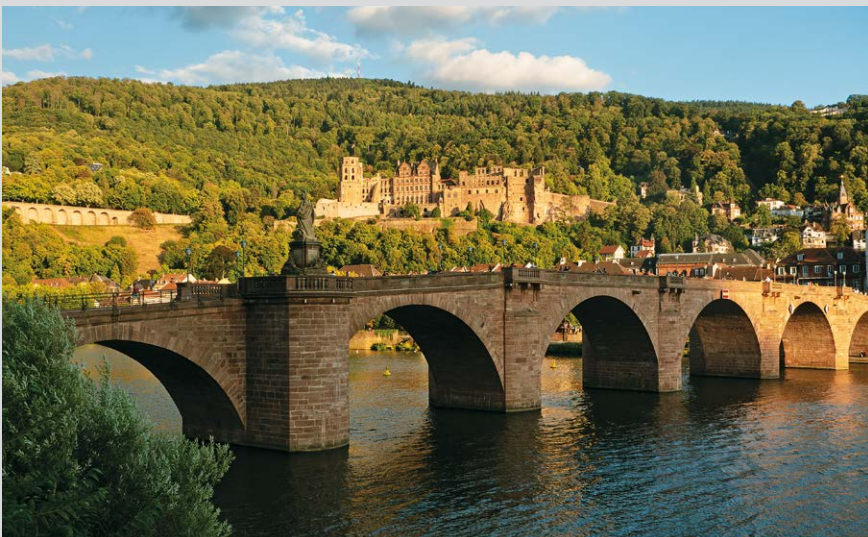
Die Alte Brücke und Schloss Heidelberg.