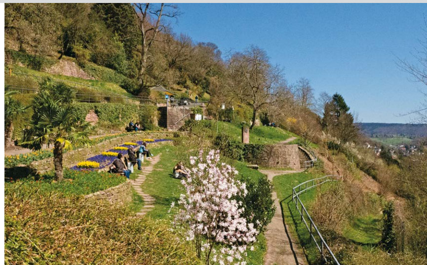
Philosophenweg im Frühling.

Karte: Wanderkarte Heidelberg Neckartal-Odenwald (GNBO Blatt 12, 1:20.000). Hessischer Odenwald Süd (Meki Landkarten GmbH, 1:30.000).