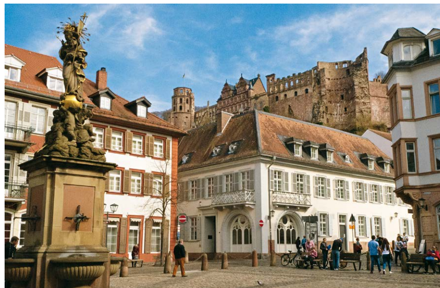
Mariensäule am Kornmarkt unterhalb des Schlosses.

Neckarsteigs. Ein kleiner Pfad führt durch den Wald im Zickzack an der Bergbahnstation vorbei zur Molkenkur (6) . Sofern das Tor zum ehemaligen Traditionslokal geöffnet ist, biegen wir an der Bushaltestelle rechts ab und schlendern über die Terrasse. Ansonsten folgen wir den Markierungen und biegen nach 50 m rechts ab. Vorbei an wenigen Resten einer mittelalterlichen Burg führt uns nun der rote Balken auf dem Friesenweg bergab. An der ersten Kehre verlassen wir den Weg scharf links. Nach einigen Serpentinien geht es über Neue Schlossstraße und den Schlossberg zurück in die Stadt. Am Faulen Pelz, dem ehemaligen Stadtgefängnis, nehmen wir ein paar Stufen zur Kettengasse und gehen unmittelbar nach links in die Seminarstraße. Linker Hand passieren wir das historische Carolinum (7) . Das sogenannte Collegium Academicum (CA) hat eine bewegte Geschichte als Kloster, Heilanstalt, SA-Kaserne und Mittelpunkt der Studentenbewegung hinter sich. Auf der gegenüberliegenden Seite hinter einem Tor auf dem Campus der Universität können wir einen Blick auf den Hexenturm werfen, der in früheren Jahrhunderten als Gefängnis diente. Im einst angebauten Augustinerkloster stellte 1518 Martin Luther Heidelberger Studenten seine Thesen vor. Kurz darauf passieren wir die reich mit Ornamenten verzierte Unibibliothek und wandern dann rechts über die Plöck mit ihren originellen Geschäften zur beliebten Hauptstraße von Heidelberg und auf dieser links zurück zum Bismarckplatz (1) .