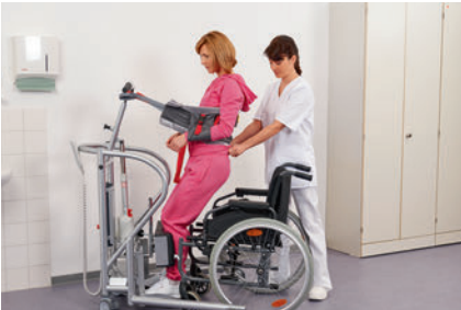
die rückschonende Arbeitsweise durch Hilfsmittel ... aids to reduce back-straining work استخدام أدوات مساعدة من أجل راحة الظهر أثناء العمل روش کار متناسب با فرم ایده آل کمر با کمک ابزار کمکی