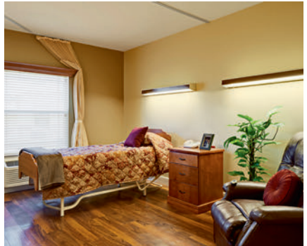
das Bewohnerzimmer resident's room غرفة النزيل اتاق ساكنين