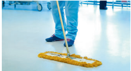
die Flächendesinfektion floor disinfection تطهير الأسطح ضد عفونی كردن سطوح