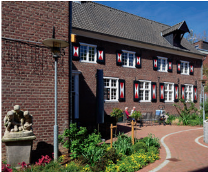
das Seniorenheim retirement home دار للمسنين خانه سالمندان