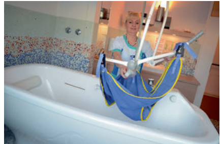
die Umsetz- oder Aufrichthilfe moving or raising aid مساعدة المريض على النهوض أو تغيير وضعه ایزار کمکی برای جا به جایی یا سر پا ایستادن