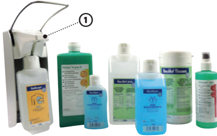
das Desinfektionsmittel disinfectant المادة المطهرة ماده ضد عفونی کننده

انواع ضد عفونی - أساليب التطهير (تطهير = تقليل عدد الجراثيم)