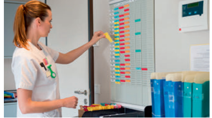
die gesundheitsverträgliche Dienstplangestaltung balanced duty roster وضع جدول دوام يتواءم مع متطلبات الصحة تدوين برنامه کاری سازگار با سلامتی