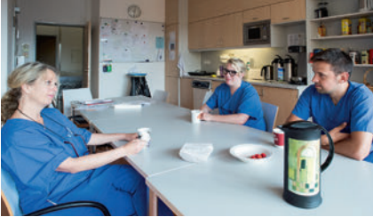
die Einhaltung von Pausenzeiten adherence to break times الالتزام بأوقات الاستراحة رعايت ساعات استراحت