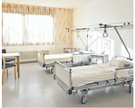
das Patientenzimmer patients room غرفة المريض اتاق بيمار