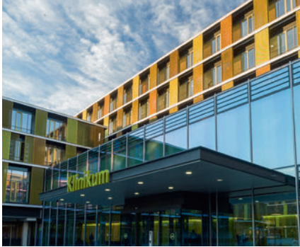
das Krankenhaus hospital مستشفى بيمارستان