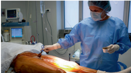
die Hautdesinfektion skin disinfection تطهير الجلد ضد عفونی كردن پوست

① die hohe Keimdichte high microbial concentration ارتفاع كثافة الجراثيم مقدار زیاد ميكروب