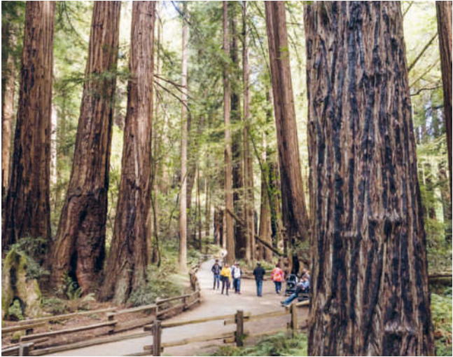
Auf dem Muir Woods Loop unter imposanten Küstenmammutbäumen

8 Genießerisches Abstrampeln Frischen Wind um die Nase und tolle Ausblicke garantiert eine Radtour über die Golden Gate Bridge > S. 101 bis ins hübsche Städtchen Sausalito. Leihfahrräder gibt es z. B. bei CityRide Bike Rentals ■ F2, die in Kooperation mit SoSF Bike Tours die Tour auch mit Guide anbieten (1325 Columbus Avenue, www.cityridebike.com , www.sosfbiketours.com ).