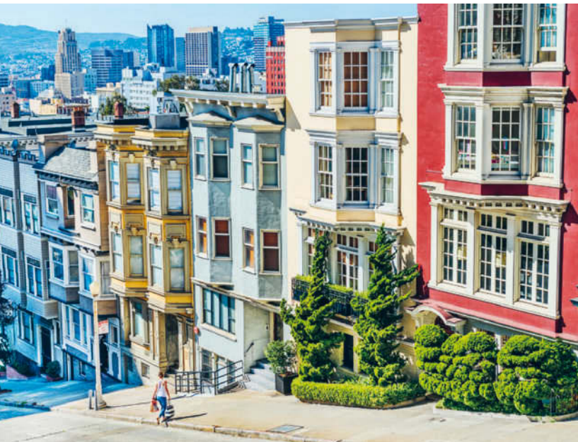
Viktorianische Häuserzeile in der Mason Street, im wohlhabenden Stadtteil Nob Hill

San Francisco Süden schließt mit The Castro das lebhaftes Schwulen- und Lesbenviertel der Stadt ebenso ein wie den mancherorts noch immer lateinamerikanisch geprägten Mission District mit der historischen Mission San Francisco de Asis. Zu den Attraktionen gehören die mit Hunderten Wandmalereien ( murals ) dekorierten Straßenzüge, die den Stadtteil zur Open-Air-Kunstgalerie machen. Und vom nahen Doppelhügel Twin Peaks im gleichnamigen Viertel genießt man schließlich ein herrliches Panorama.