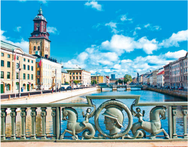
Die Hafenstadt Göteborg an der Westküste ist geprägt von Kanälen und Brücken

von Schären bestimmt wird. Im Landesinneren schließt sich der waldreiche Westen an. Dalsland und Värmland durchziehen immer tiefer werdende Wälder, die von langen Tälern unterbrochen werden. Oft ist es schwer zu erkennen, ob darin ein Fluss fließt oder ein stiller See liegt, denn viele Seen sind in diesem Landesteil lang und schmal. Ganz anders verhält es sich mit dem Vänern ; der größte See des Landes hat fast meerartigen Charakter und sogar eine eigene Schärenlandschaft. Die natürlichen Gewässer verband man mittels Kanälen zu Transportwegen. Vom Vänern gelangt man über den Dalsland-Kanal nach Norwegen, und auch der Göta-Kanal, der berühmteste Kanal des Landes, der im 19. Jh. erstmals eine Inlandsverbindung per Schiff zwischen Stockholm und Göteborg gewährleistete, bezieht den See mit ein. Heute werden die historischen Wasserstraßen hauptsächlich von Freizeitbooten genutzt.