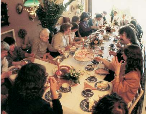
Bei Geburtstagen, Jubiläen und anderen Familienfesten kommen die Generationen ins Gespräch.