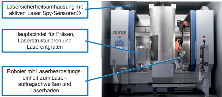
Bild 1.2: Multi-Technologie Maschine für die Laser- und zerspanende Bearbeitung

und Scope und wirft unter anderem die Frage „Wie können dem Kundenwunsch angepasste Produkte zu seriennahen Stückkosten hergestellt werden?“ auf. Als eine mögliche Lösung wurde die Erweiterung konventioneller Fertigungssysteme um Systemelemente, Wirkmechanismen oder die Integration von Prozessschritten in bestehende Fertigungssysteme identifiziert. Diesem Ansatz folgend wurde eine Multi-Technologie Maschine (MTM), in der Zerspanen mit geometrisch bestimmter Schneide und Bearbeitung mittels Laser durchgeführt werden können, aufgebaut, Bild 1.2. [BREC11a] [BREC16d]