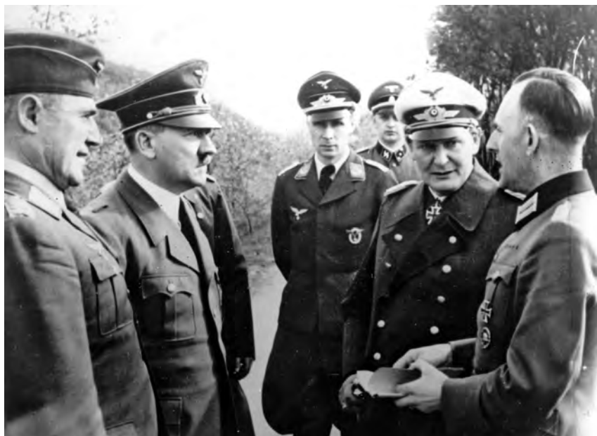
Luftwaffen-Adjutant Nicolaus von Below (Mitte) gehörte zu den engsten Vertrauten Hitlers. Rechts im Bild Hermann Göring sowie der Chef des Heerespersonalamts, Rudolf Schmundt. Die Aufnahme stammt aus dem Jahr 1940.

So machten sich die beiden Männer auf den Weg, ausgerüstet mit MP40 Maschinenpistolen, ein wenig Verpflegung und Landkarten. Ihr Weg führte sie zunächst über die Hermann-Göring-Straße (heute: