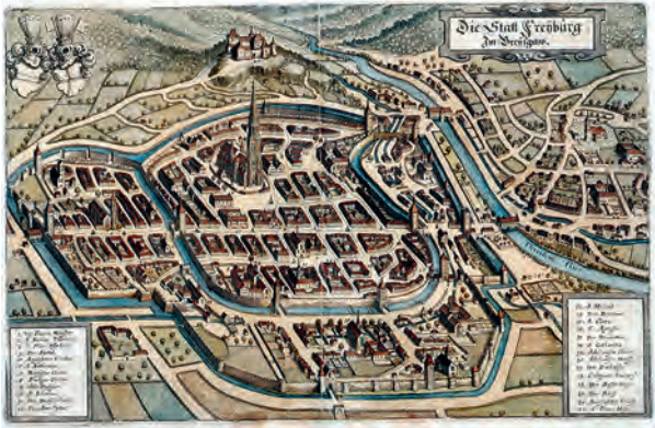
Vogelschau auf Freiburg um 1600 aus Matthäus Merians Topographia Alsatiae , Frankfurt a. M. 1644

Der Dreißigjährige Krieg erreichte die Stadt spät. 1632 wurde sie erstmals von den Schweden besetzt. In der Folge wechselten die Besatzer mehrfach. Höhepunkt war die blutige Schlacht im Sommer 1644, bei der die »Reichsarmee« auf zwei französische Heere traf. Am Ende des Dreißigjährigen Krieges war