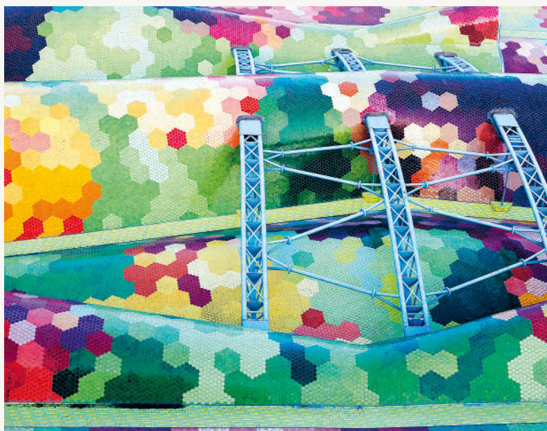
Das Hallendach des Mercat de Santa Caterina ist ein echter Hingucker.

der 1881 gebaute Mercat de Sant Antoni ist natürlich der direkt an den Rambles gelegene Mercat de San Josep de la Boquería (→ S. 71) – am frühen Morgen kaufen hier, im »Bauch von Barcelona«, sogar Köche aus den besten Restaurants der Stadt ein. Um die alten Hallen fit für die Zukunft zu machen, wurden und werden die Märkte jetzt modernisiert. Dabei erhielt die älteste Halle der Stadt, der im Jahr 1845 erbaute Mercat de Santa Caterina in El Born, ein neues, geschwungenes kunterbuntes Dach, das an einen Drachenrücken erinnern soll. Der eingangs erwähnte Mercat de Sant Antoni wurde um zusätzliche Untergeschosse und Tiefgaragen ergänzt, sogar ein Disc-counter ist jetzt eingezogen.