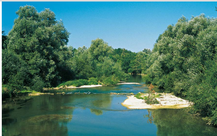
Der natürliche Flusslauf der Saulx.

Vom Parkplatz bei der Kirche in Heiltz-le-Maurupt (1) nehmen wir die Rue de la Place kurz nach Süden und dann die erste Seitenstraße nach rechts (Tafel »3,5 t«). An der nächsten Gabelung halten wir uns links bis zu einer Kreuzung und dort geradeaus. Auf der schmalen D214 verlassen wir nun den Ort und überqueren die Chée auf einer Brücke. An eine Links- und eine Rechtskurve schließt sich eine gerade Strecke durch eine Platanenallee an. Nach einem Bach, der in einem Graben fließt, biegen wir rechts in einen gelb markierten Weg ein, der von Bäumen gesäumt wird und folgen dem Graben für etwa 700 m zwischen Wiesen und Feldern. Am Beginn eines Pappelwäldchens biegen wir links ab und wandern auf einem teilweise verwachsenen Weg nach Süden durch das Wäldchen, wobei wir in diesem Abschnitt sorgfältig auf unsere gelben Zeichen achten. So erreichen wir nach gut 250 m einen malerischen Baggersee und gehen rechts auf einem breiten Wiesenweg an seinem von Bäumen gesäumten Ufer entlang bis zu seinem Ende, wo wir nach links weiter an seinem Ufer bleiben. Kurz vor dem südlichen Seeende geht es nach rechts zu einem Teersträßchen und auf ihm nach links zur schon bekannten D214 (2) . Auf ihr wandern wir nach rechts über