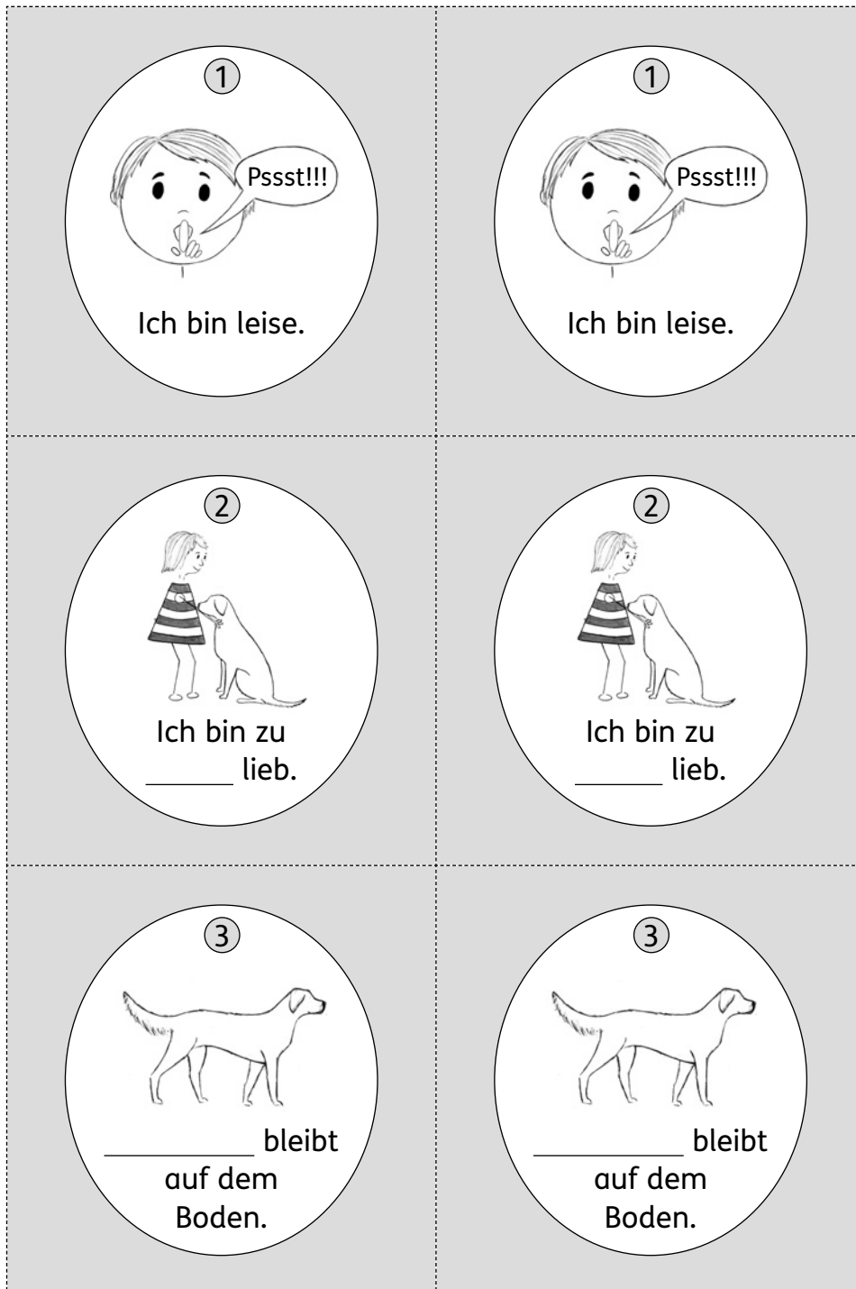
Abb. 8: Kopiervorlage Memo-Spiel Teil 1 (KV 2)