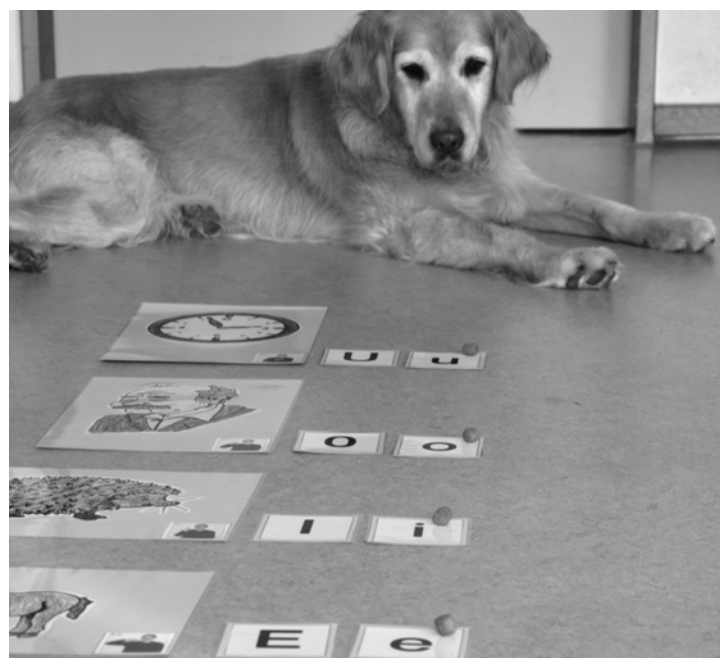
Abb. 12: Bildkarten der Buchstabenstraße mit Leckerchen nach richtiger Lösung