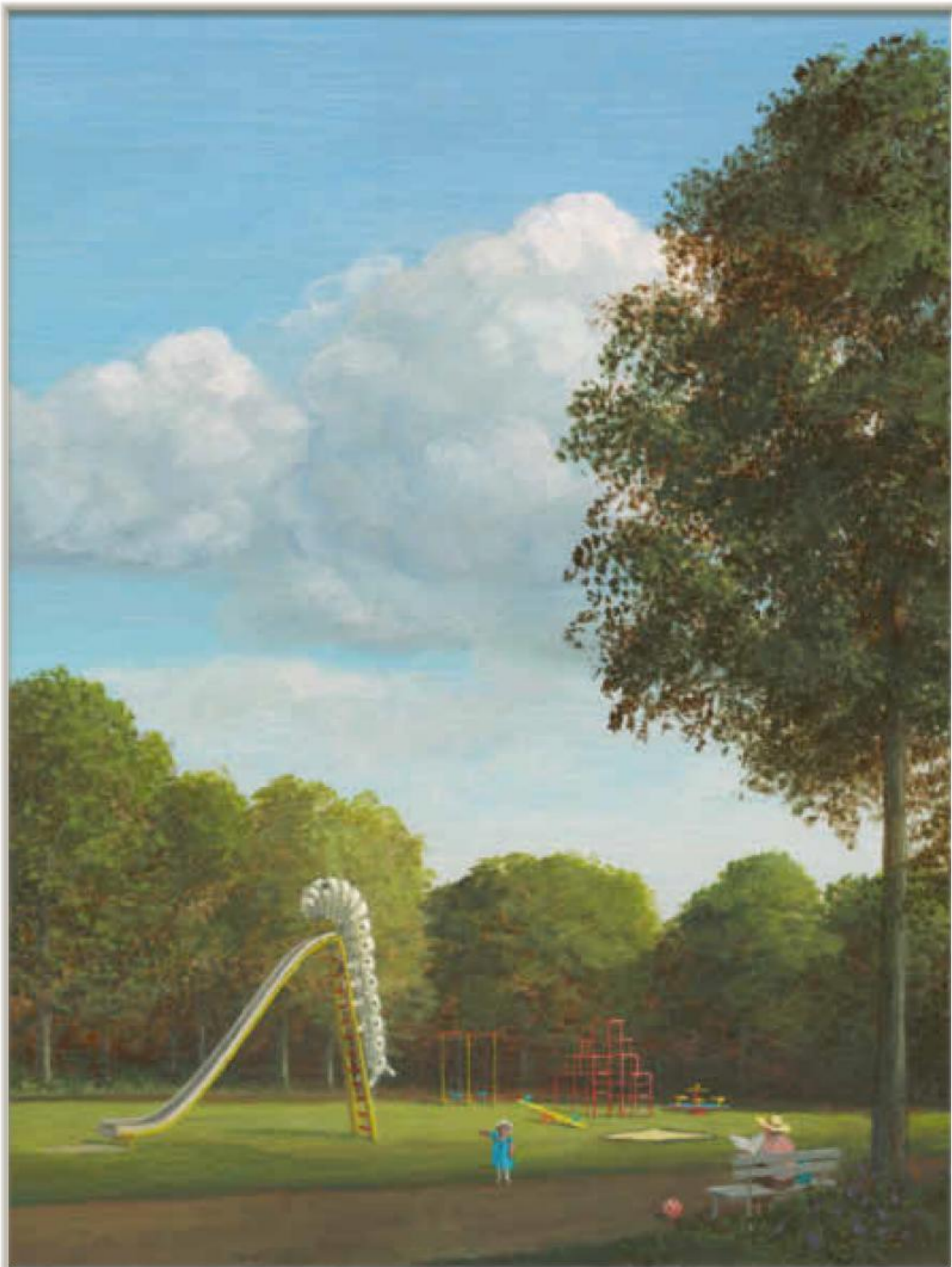
Nachmittag im Park