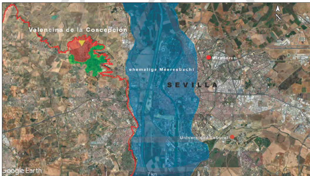
Abb. 2 – Lage des kupferzeitlichen Siedlungsareals (rot) und der Nekropole (grün) im Gemeindegebiet von Valencina de la Concepción und Castilleja de Guzman (Provinz Sevilla, Andalusien). Lage der Ausgrabungen 2017/2018 (gelbes Dreieck), weitere Fundplätze des Chalkolithikums (rote Punkte) und Ausdehnung der Meeresbucht in prähistorischer Zeit (blau); Nordoststrand des Aljarafe (rote Linie).