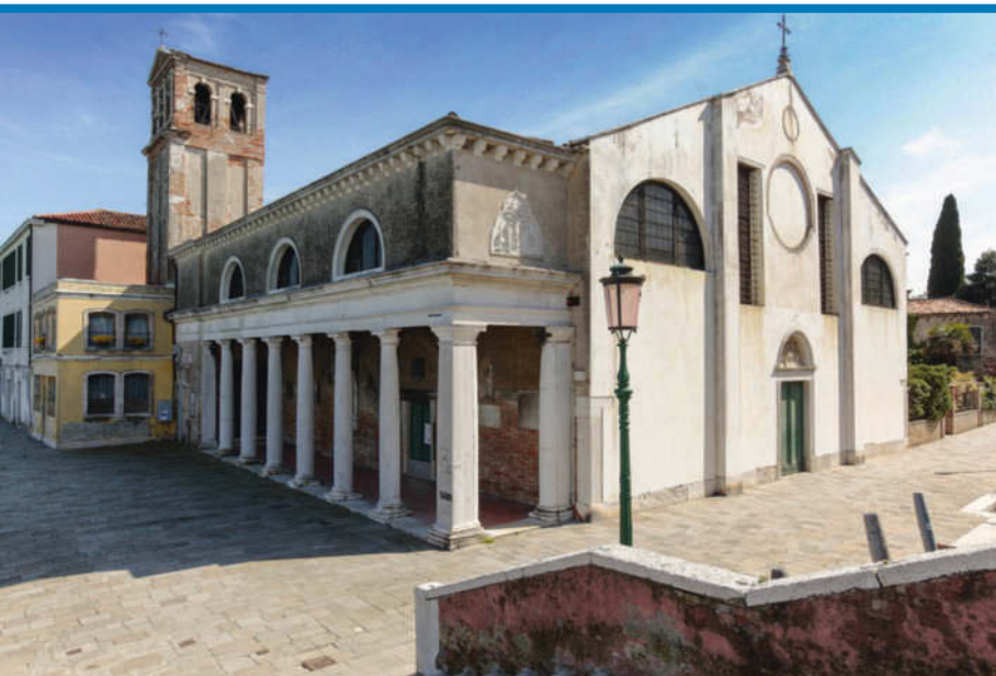
Kein Besuchermagnet, aber dennoch sehenswert: die Kirche Sant' Eufemia