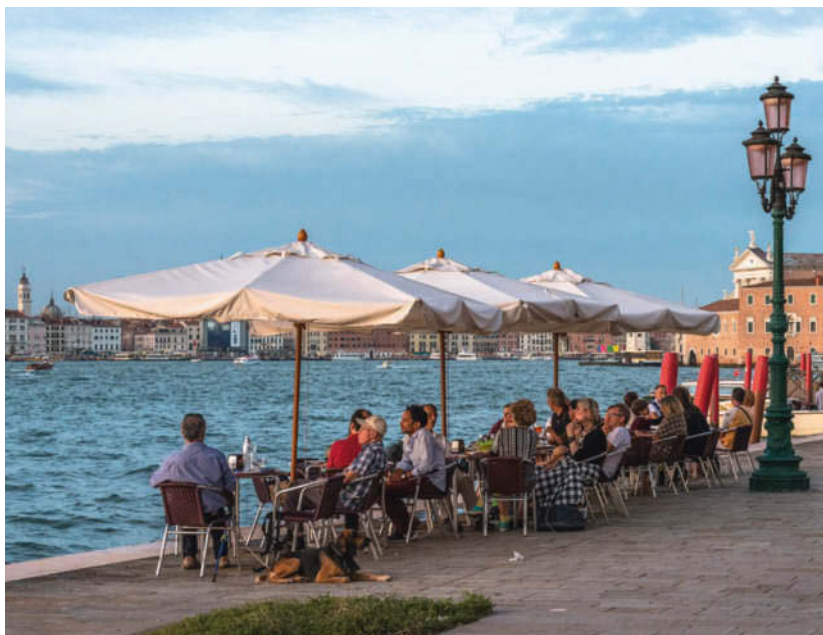
Von der Uferpromenade auf der Giudecca schweift der Blick bis zum Markusplatz