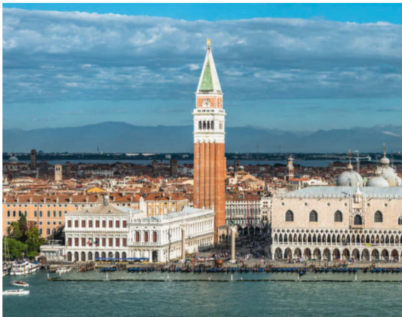
Venedigs Skyline von San Giorgio Maggiore aus mit Campanile und Dogenpalast

Die Lagunenstadt gleicht einem Weltwunder, das jedes Jahr Millionen von Besuchern aus aller Welt fasziniert