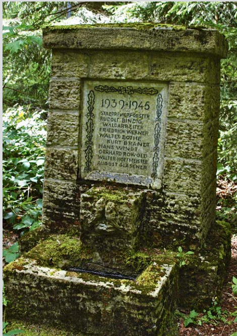
Denkmal für gefallene Waldarbeiter.

Fernwanderweg E 11 (Niederlande–Harz–Masuren) und führt auf einem schmalen Stieg zu einem Waldarbeiterdenkmal und nach Bad Harzburg. Wir folgen diesem Stieg, vorbei an dem Denkmal für gefallene Waldarbeiter, überqueren eine kleine Holzbrücke über die Gelmke und halten uns gleich nach der Brücke links. Der Pfad folgt jetzt dem kleinen Gewässer zunächst in nördliche Richtung und biegt dann nach Osten ab. Nach rund 800 m treten wir aus dem Wald heraus und erreichen offenes Gelände. Im Spätsommer blüht hier auf großen Flächen leuchtend violett das Heidekraut. Die vorhandene Vegetation aus Goldhafer, Schmiele und Heidekraut deutet auf stark versauerten Boden hin. Dies ist Folge der früheren Hüttenrauchemissionen und des hier anstehenden Sandsteins. Links unterhalb des Wegs können hinter Bäumen große Wasserflächen erkannt werden. Dies sind ehemalige Schlammteiche des früheren Bergwerks. Am Ende der Wiese folgen wir der