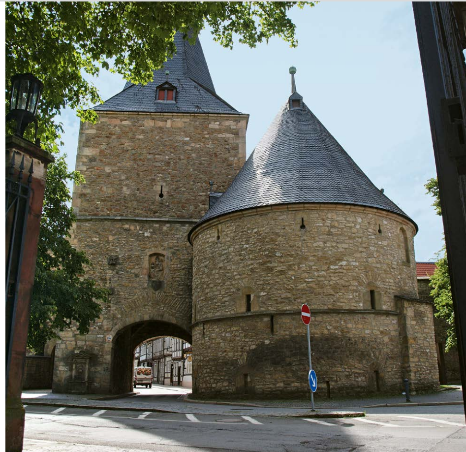
Das Breite Tor in Goslar.

Wir wandern aus der Altstadt von Goslar ① in östlicher Richtung über das Breite Tor hinaus. Nach dem Durchschreiten des Breiten Tors überqueren wir die Okerstraße und gehen in Richtung der vor der Wallanlage vorbeiführenden Bundesstraße B 241. Hier halten wir uns rechts (Richtung Clausthal) und biegen nach wenigen Metern auf einen in die Wallanlagen führenden Fußweg ein. Auf diesem orientieren wir uns weiter links, bis wir nach etwa 200 m einen Fußgängerüberweg über die