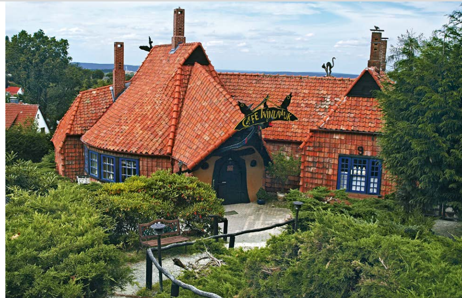
Das Künstlercafé Winuwuk vor Bad Harzburg.

Adenbergstraße. Hier (Wegweiser E 11) folgen wir der asphaltierten Anliegerstraße nach rechts, um diese nach etwa 50 m im Kurvenbereich wieder zu verlassen. Ab hier folgen wir einem unbefestigten Waldweg vorbei an einem kleinen Rastplatz und einem Wasserbehälter weiter nach Osten. Nach rund 700 m erreichen wir eine Wegkreuzung. Hier findet sich nunmehr auch wieder eine Ausschilderung der Wege. Wir folgen dem auch für Radfahrer ausgewiesenen Gatterweg (E 11) weiter nach Osten in Richtung Bad Harzburg. Der Weg führt durch ältere Nadel- und Laubwaldbestände, vorbei an der Bosequelle und einer Begräbnisstätte für Haustiere der Landesforstverwaltung (Abschiedswald Goldberg) und erreicht nach rund 2 km das Café Goldberg ③ (Dienstag Ruhetag). Von der Ter-