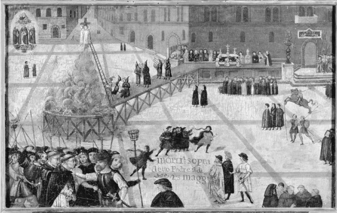
Hinrichtung Savonarolas in Florenz, 1498

ihre gesetzliche Mündigkeit erst mit achtundzwanzig. Doch Machiavelli sollte seine Jugend und Unerfahrenheit durch eindrucksvolle intellektuelle Fähigkeiten und eine untadelige Bildung ebenso wettmachen wie durch enorme Tatkraft und gewaltigen Ehrgeiz.