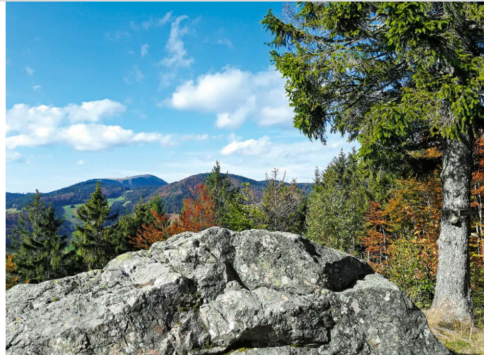
Tannharzfelsen mit Blick zum Belchen.

1100 m. Wer mag, findet ca. 100 m rechter Hand eine Bank mit Panoramablick. Von der blauen auf die gelbe Raute wechselnd führt uns der Weiterweg zum Abzweig Lailehöhe 5 und dem Hauptweg treu bleibend weiter. Die bisher eher spärlichen Aussichten über das Naturschutzgebiet Wiedener Weidberge erfahren spätestens ab hier eine deutliche Aufwertung, wobei das herrliche Panorama zum Belchen und nach Wieden auf mehreren Sitzbänken ausgiebig genossen werden kann. Der breite Weg führt uns rasch zur Hasbacher Höhe 3 zurück und weiter nach Süden. Kurz vor dem Almgasthaus Knöpflesbrunnen verlassen wir das durch Rauten markierte Wegenetz des Schwarzwaldvereins und besteigen über einen Wiesenpfad rechts haltend den höchsten Punkt des Knöpflesbrunnen 6 , 1124 m, wo sich ein herrliches Panorama öffnet.