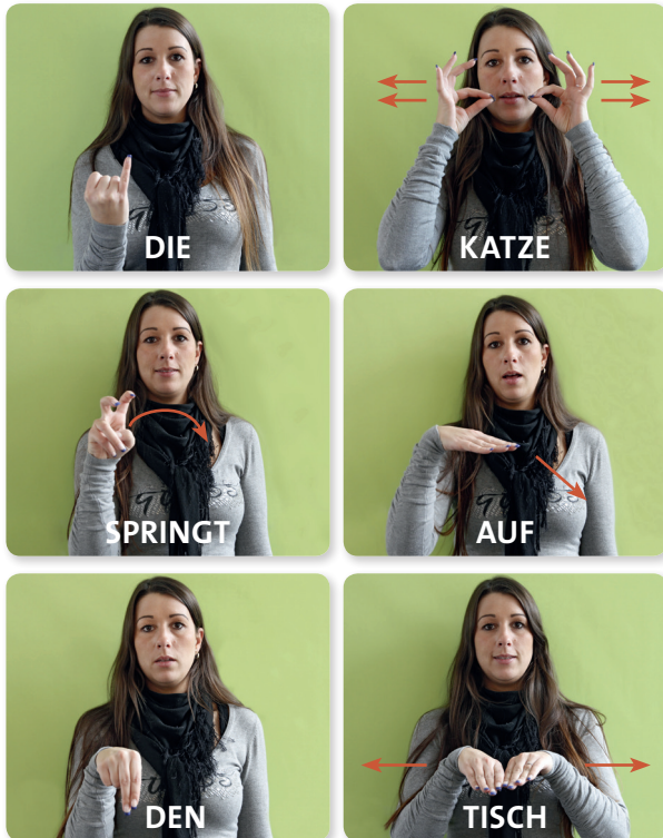
Abb. 1 Beispiel für die lautsprachbegleitenden Gebärden (LBG)

Die lautsprachbegleitenden Gebärden unterscheiden sich von der deutschen Gebärdensprache insofern, als sie keine eigene Sprache darstellen, sondern vielmehr die verwendete Lautsprache begleitend sichtbar machen. Struktur, Aufbau und Grammatik der Lautsprache bleiben unverändert (► Abb. 1).