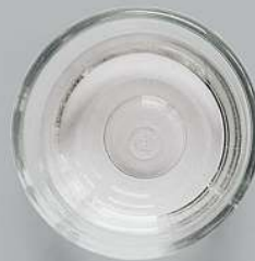
Schale mit warmem Wasser