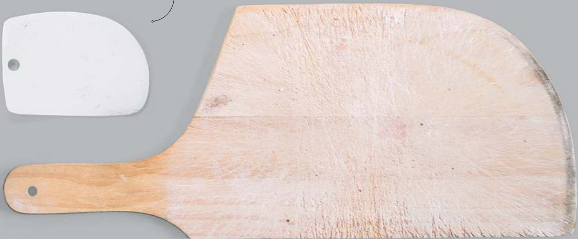
Brotschieber oder Ähnliches