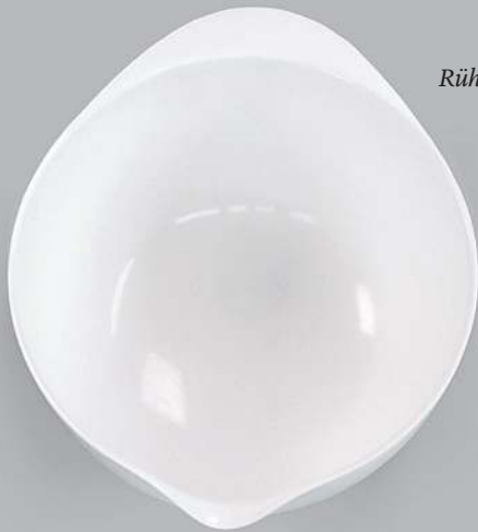
Rührschüssel mit Skalierung (2-4 Liter)