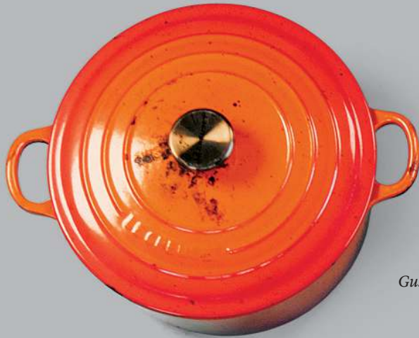
Gusseiserner Topf oder Schamottesteine