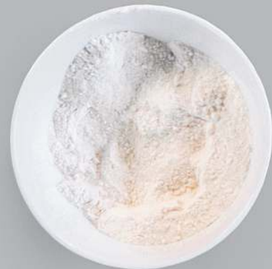
Mehl zum Bestäuben