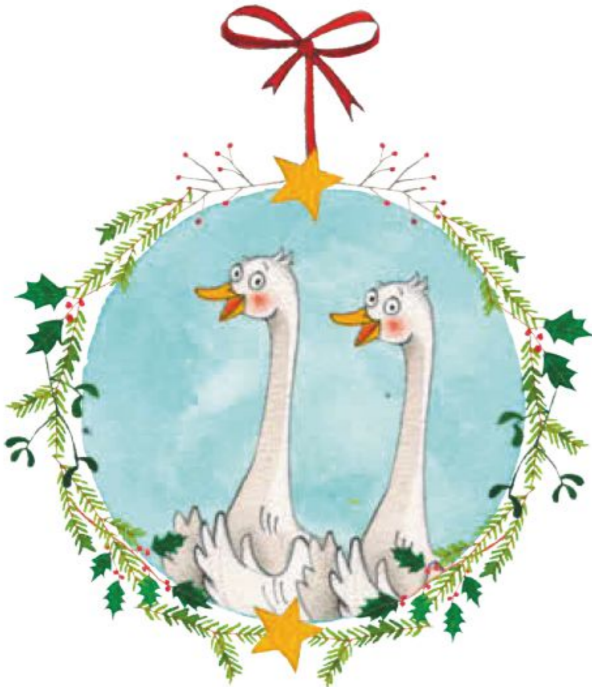
Walter & Walter