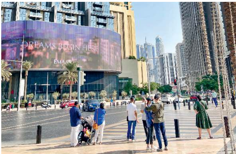
Downtown Dubai: »Dreams begin here«

Nach meiner Ankunft, mitten in der Nacht, fuhr ich mit meinen emiratischen Bekannten die Sheikh Zayed Road hinunter, links und rechts große weite Flächen Sand, unbebaute Grundstücke. Ein gigantisches