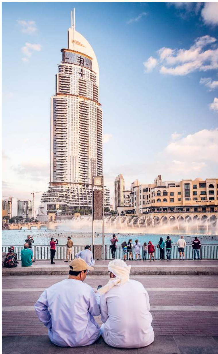
Blick auf den Burj Khalifa Lake mit seinen Wasserspielen