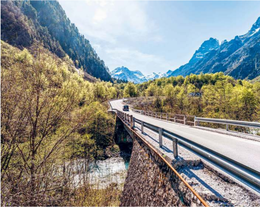
Auf der Fahrt von Kukës ins Valbonatal sieht man schon von Weitem die schneebedeckten Berge.