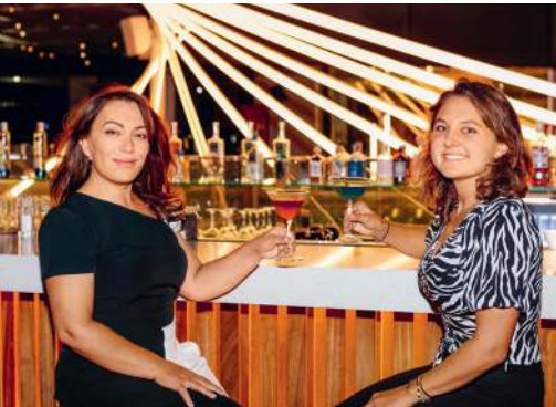
»Gezuar!« – Prost auf unser gemeinsames Buch!