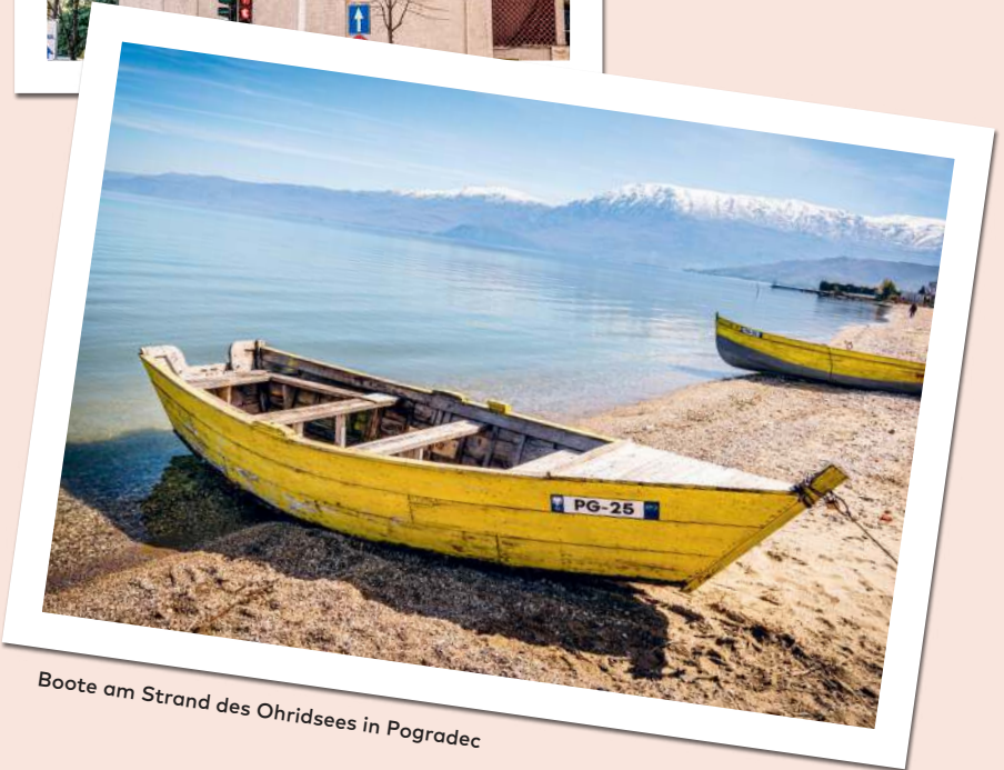
Boote am Strand des Ohridsees in Pogradec