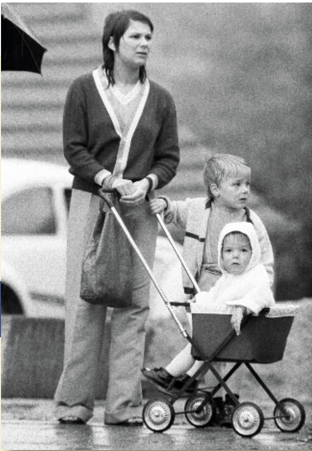
Dieser Spaziergang fiel ins Wasser.

der Platz nicht nur für diejenigen zu eng, die in Notunterkünften lebten. Zum Beispiel im Wohnlager Solomit in Neumühlen-Dietrichsdorf, wo sich die Bewohnerzahl zu Anfang der 70er zwar mehr als halbierte, das aber bis etwa Mitte der 80er-Jahre mehr als 200 Bewohner zählte.