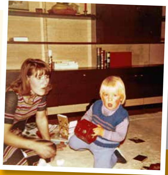
Die Regale in der neuen Schrankwand sind (noch) leer.

In der Kieler Altstadt findet wieder der „Kieler Umschlag“ statt