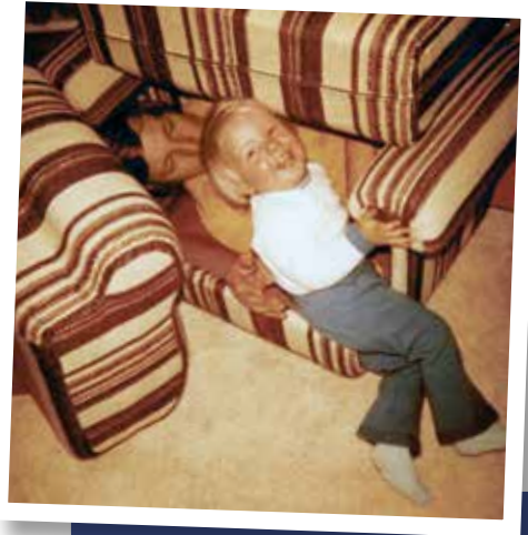
Vater und Sohn beim kreativen Versteckspiel 1972. Man beachte die zeittypische Einrichtung!

Zugleich zeigen uns die Kindheitsfotos, dass die Eltern lachend mit uns Höhlen in den neuen Sofagarnituren bauen und unbeschwert mit uns spielen. Wir haben unsere Kindheit in einer Zwischenzeit erlebt, in der mit den knalligsten Farben das Grau und Schwarz der Vergangenheit vertrieben werden sollte, deren Schatten aber, wie wir heute wissen, viel dunkler und länger waren, als man sich das damals ausmalen konnte.