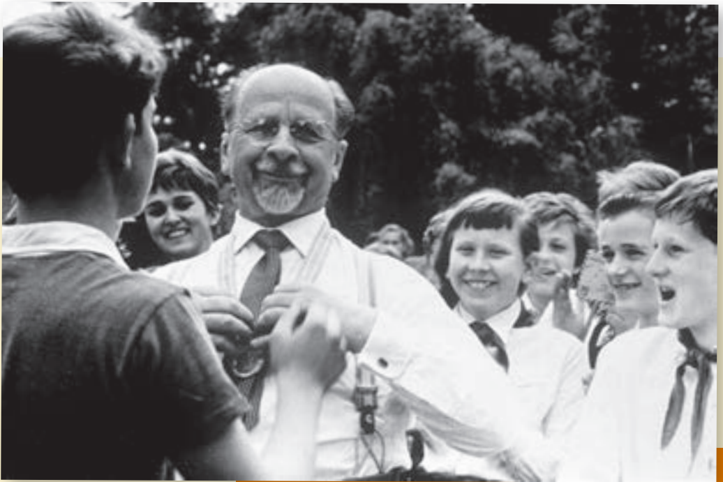
Walter Ulbricht bestimmte lange unser Schicksal in der DDR.

Wir Hausgeborenen hatten es von Anfang an gut. Die Mutti konnte uns schon in der ersten Lebenswoche auch außerhalb der Stillzeit in den Arm nehmen. Manchmal aber wurde es stressig. Zunächst täglich, später sporadisch, besuchte uns die Hebamme und erteilte irgendwelche Anweisungen und Ratschläge. Hinzu kamen die zahlreichen neugierigen Verwandten und Bekannten, von denen jeder und jede seinen „berühmten Senf“ dazugab. Und manches Gesicht äugte in unsere kleine Wiege aus geflochtenem Korb und murmelte irgendetwas wie „Gutschi, Gutschi“. Können die Erwachsenen denn nicht ordentlich reden? Das kann ja was werden!