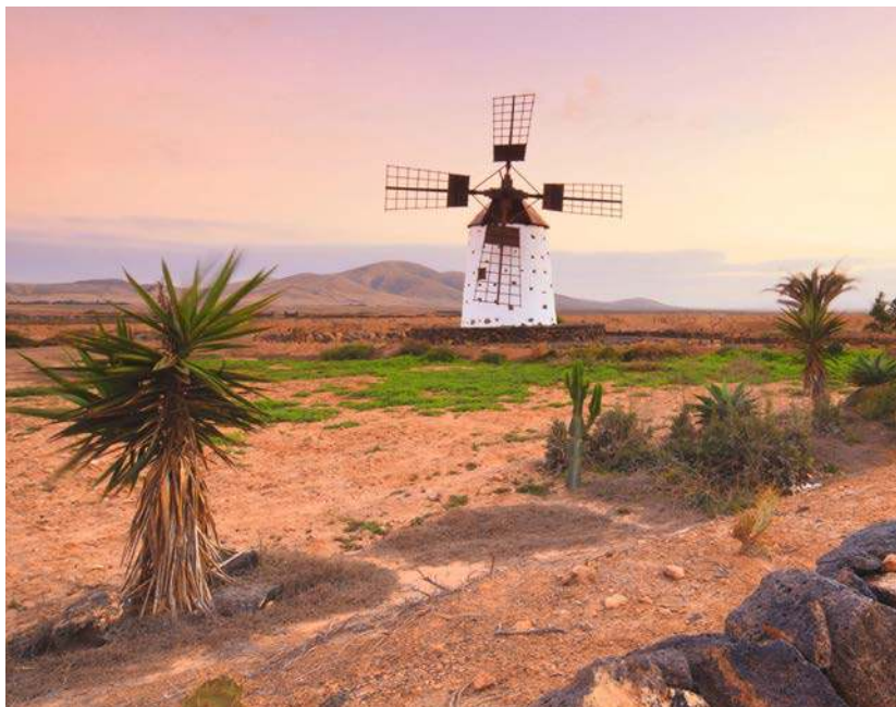
Windmühlen – Relikte aus der Zeit, als Fuerteventura Kornkammer der Kanaren war

Heller Sand wechselt mit dunklen Lavaklippen ab, in den Bergen liegen Oasen und weiße Dörfer