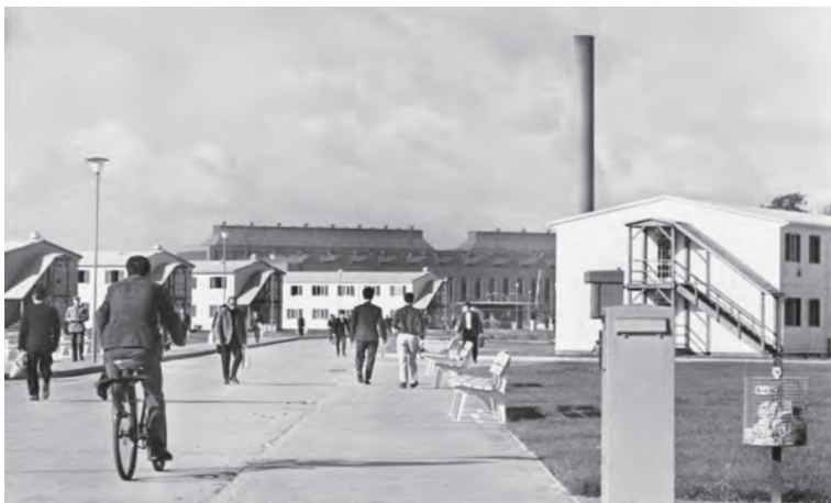
Abb. 2 : Ein weiteres Motiv aus der Serie : Das »Italienerdorf« : »Wolfsburg la città della VOLKSWAGEN. Operai al rientro dal lavoro nel »Villaggio Italiano« della VOLKSWAGEN«

Bereits wenige Wochen nach ihrer Ankunft wurden die italienischen Migranten, die im Zuge des 1955 abgeschlossenen deutsch-italienischen Anwerbeabkommens ab 1962 in großer Zahl im Wolfsburger Volkswagenwerk Arbeit fanden (Abb. 1), zum Untersuchungsobjekt der bundesdeutschen Medien. Dass das Automobilunternehmen zunächst ausschließlich und in tausendfacher Zahl auf italienische »Gastarbeiter« setzte, machte die Volkswagenwerk AG (ab 1985 Volkswagen AG) und die eng mit diesem verbundene Stadt rasch zu einem migrationshistorischen Sonderfall. 1 Journalisten und Journalistinnen spürten in zahlreichen Reportagen und Berichten den »Arbeiter[n] aus dem sonnigen Süden« nach, 2 die in der »größten Italiensiedlung nördlich des Brenner« lebten 3 (Abb. 2) und dort, so die Einschätzung eines Journalisten, an-