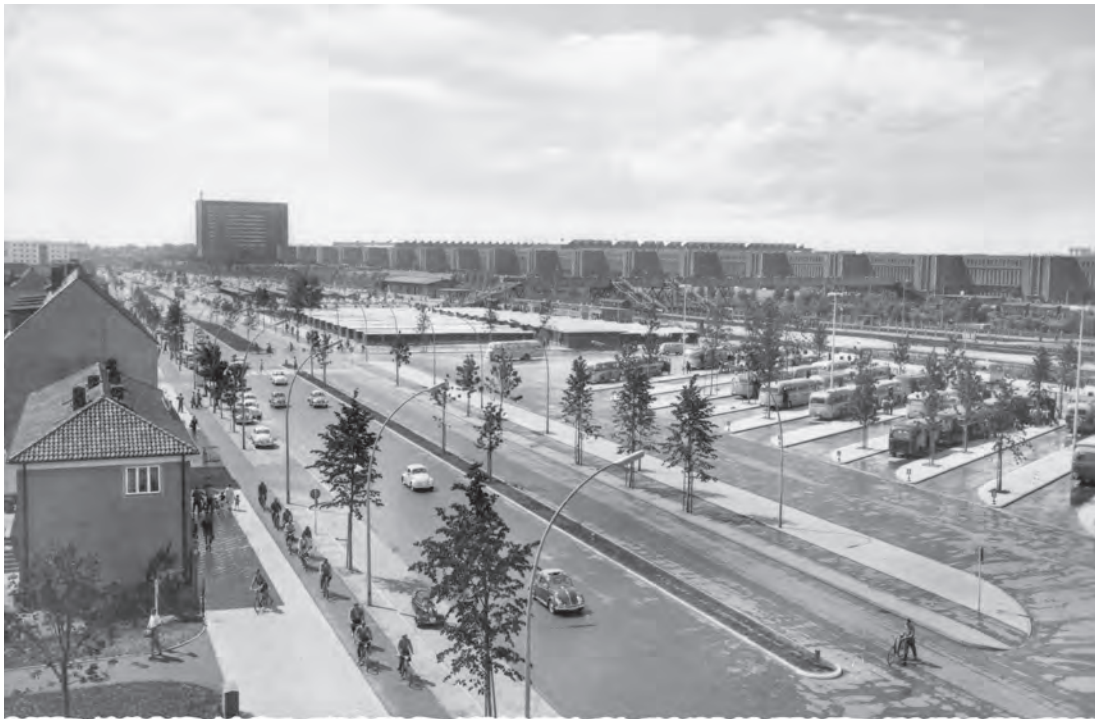
Abb. 4: Ansichtskarte »Wolfsburg. Gegenlichtaufnahme im VW-Werk«, Anfang der 1960er Jahre

zwingt, die Hoffnung antreibt, die Ferne lockt; manche Strecke bringt einen an das erhoffte Ziel, lässt einen, einmal angekommen, das Erwartete dann doch nicht finden; manche unscheinbar wirkende Zwischenetappe wiederum entpuppt sich als das unverhoffte Glück. Dem Wegbereiter der Oral History in der deutschsprachigen Geschichtswissenschaft, Lutz Niethammer, zufolge sind es just diese subjektiven Erfahrungen und Auslegungen, die die Bedeutung narrativer Interviews ausmachen, gehe es der »Erfahrungsgeschichte« doch »um die Emotionalität und die Dramatik des Außergewöhnlichen«. Denn diese brenne »sich in das Gedächtnis ein und erzeugt einen Kurzschluss zwischen einst und jetzt«. 18 Was folglich von dem zurückgelegten Lebensweg wachgerufen und in einem Oral-History-Interview erzählt wird, erlaubt demnach Rückschlüsse darauf, welche »Bedeutung [...] diese Erinnerungen für die interviewten Personen heute haben«. 19