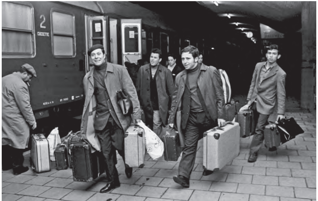
Abb. 8: Mit dem Sonderzug in den Weihnachtsurlaub in die italienische Heimat, 19. Dezember 1970; Foto: Fritz Rust / IZS