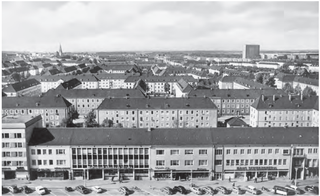
Abb. 5: Ansichtskarte »Wolfsburg. Porschestraße mit Stadtmitte«, 1960er Jahre; Verlag Carl Friedrich Fangmeier, Bad Harzburg / Postkartensammlung IZS

deutschen Gebiet, die durch die guten Verdienstmöglichkeiten und sichere Arbeitsplätze in das Zonenrenzgebiet gelockt worden waren. Stadt und Werk, so eines der damals gängigen Narrative, schienen dabei in dieser Zeit nachgerade schicksalhaft miteinander verbunden, auch wenn sich die Kommune ab den späten 1950er Jahren mehr und mehr vor allem kulturell von der Dominanz des Volkswagenwerks zu lösen suchte. Inmitten jener neuerlichen Transformationsphase begann das Werk mit der systematischen Anwerbung italienischer Arbeitsmigranten.