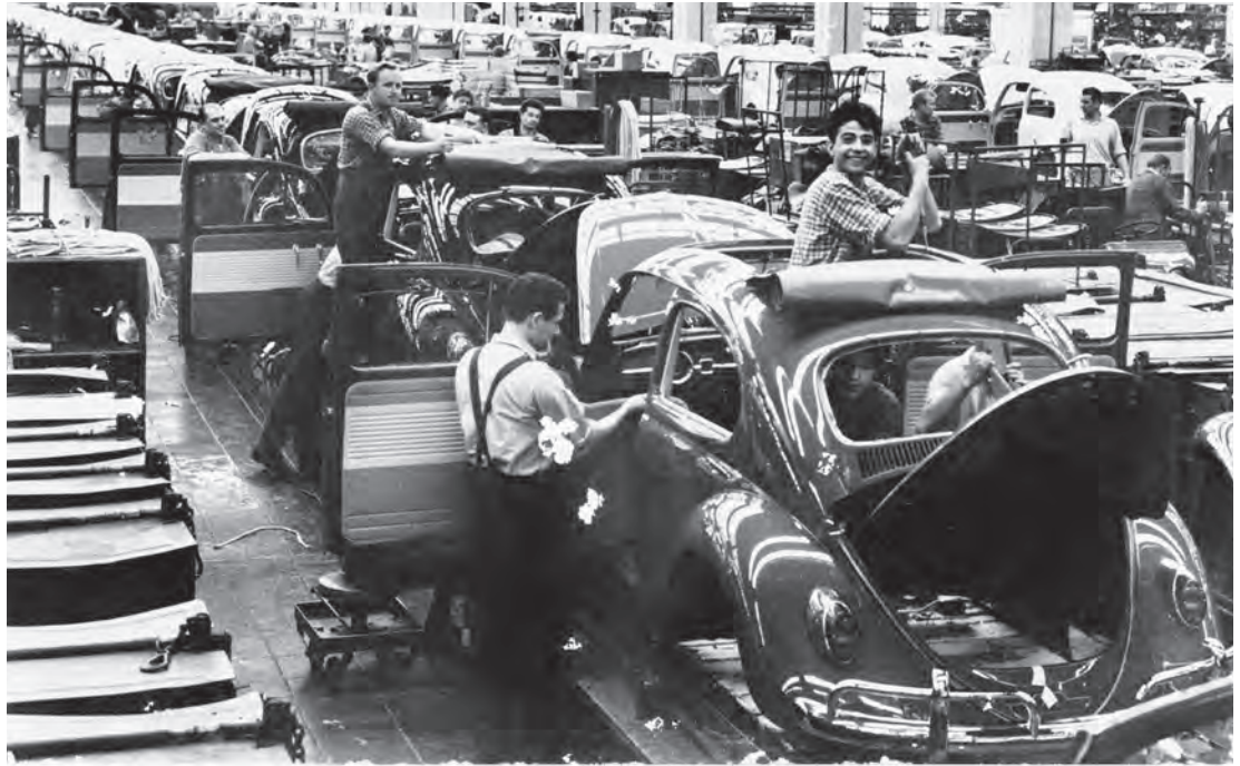
Abb. 1 : Postkarte aus einer Serie, die in den 1960er Jahren produziert worden ist. Der umseitig gedruckte Informationstext – »La Fabbrica VOLKSWAGEN a Wolfsburg. Lavoratori italiani alla catena di montaggio nella Fabbrica« – deutet an, dass die Postkarten zur Versendung durch die italienischen Arbeitsmigranten bestimmt waren

Vom Exemplarischen migrantischer Lebenswege