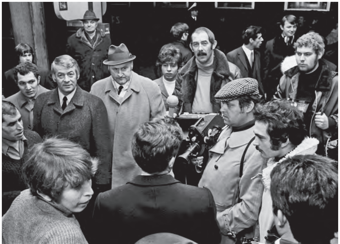
Abb. 9: Allein in dieser Nacht reisten 3.600 italienische VW-Arbeitnehmer mit vier Sonderzügen in den dreiwöchigen Heimaturlaub – Anlass genug für Funk und Fernsehen, vor Ort zu sein und zu berichten, 19. Dezember 1970; Foto: Fritz Rust / IZS