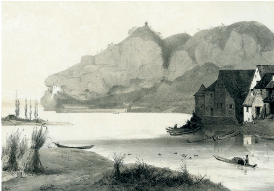
Das Dorf Istein mit Fischerhäusern und Fischerbooten vor der Rheinbegradigung. Lithographie von Friedrich Kaiser von 1849. DLM BKKa 14.

Heute sind nur noch rund 2% der Oberrheinaue intakt. Nun wird grenzüberschreitend versucht, einen Teil der Schäden wieder rückgängig zu machen. Staustufen werden mit Fischtrepfen ausgestattet. Der Rhein erhält neue Überschwemmungsflächen.