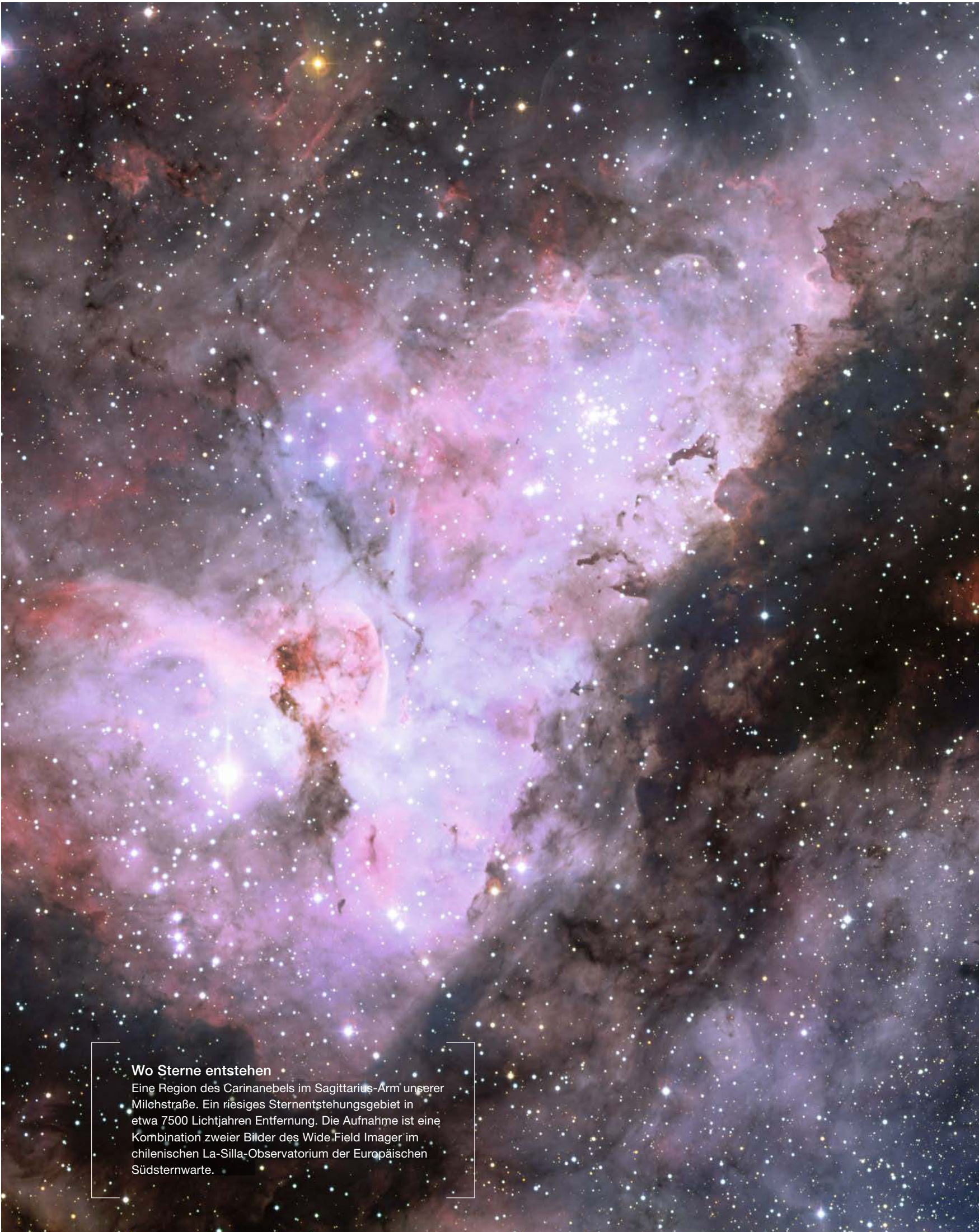
Wo Sterne entstehen Eine Region des Carinanebels im Sagittarius-Arm unserer Milchstraße. Ein riesiges Sternentstehungsgebiet in etwa 7500 Lichtjahren Entfernung. Die Aufnahme ist eine Kombination zweier Bilder des Wide Field Imager im chilenischen La-Silla-Observatorium der Europäischen Südsternwarte.