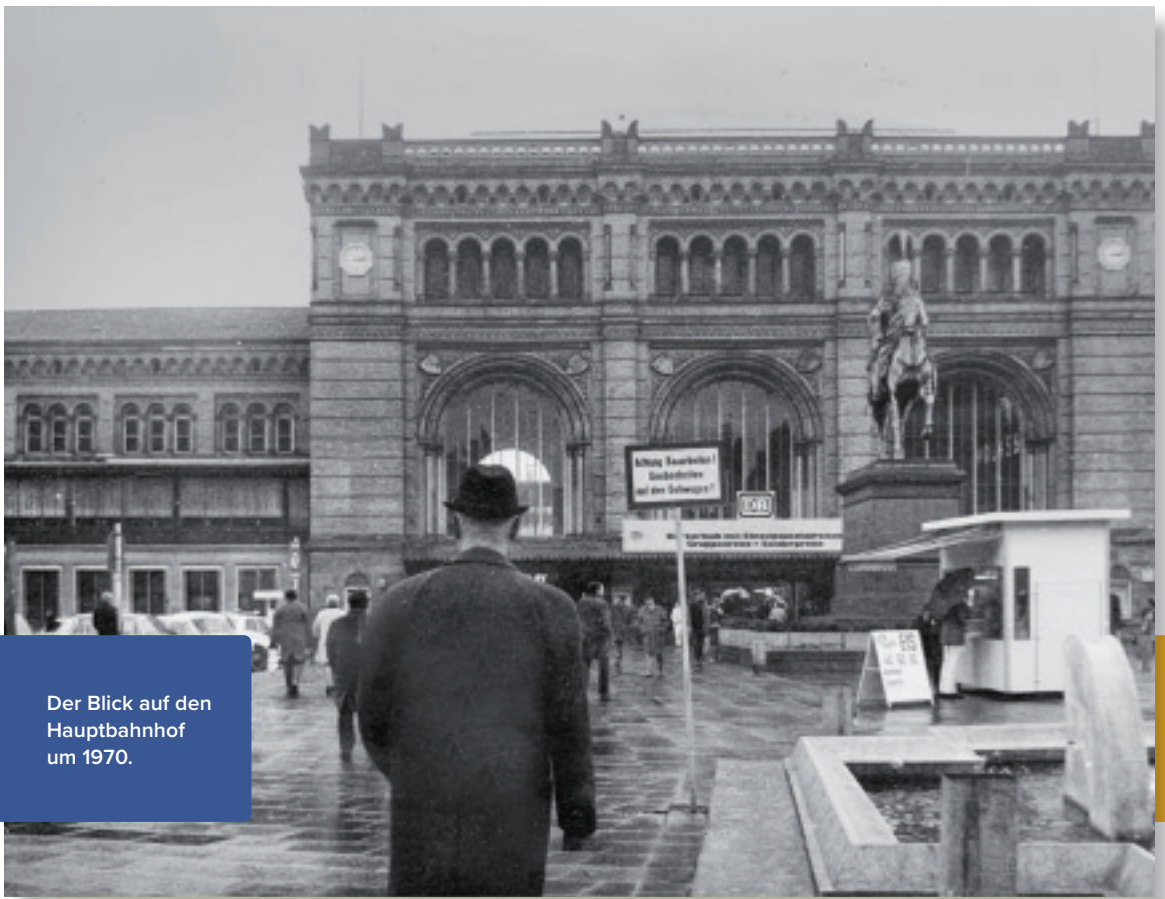
Der Blick auf den Hauptbahnhof um 1970.