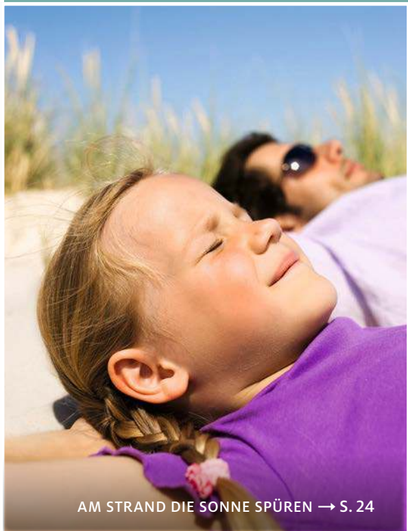
AM STRAND DIE SONNE SPÜREN → S. 24