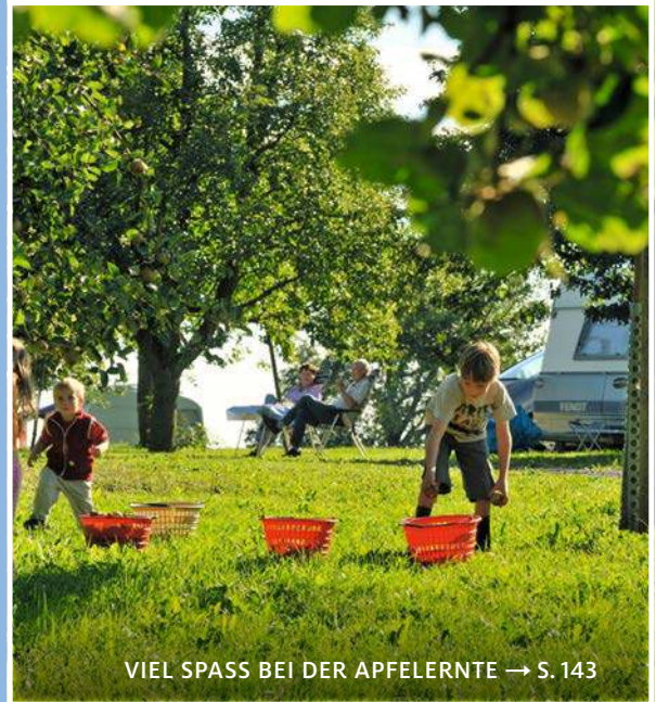
VIEL SPASS BEI DER APFELERNTE → S. 143