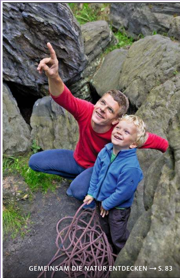
GEMEINSAM DIE NATUR ENTDECKEN → S. 83