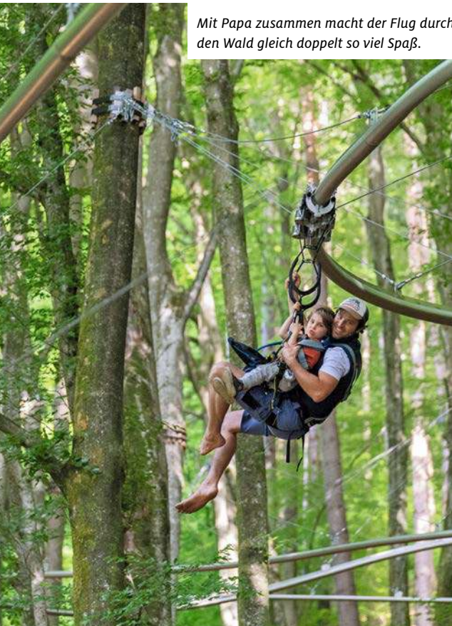
Mit Papa zusammen macht der Flug durch den Wald gleich doppelt so viel Spaß.