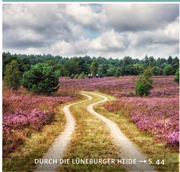
DURCH DIE LÜNEBURGER HEIDE → S. 44