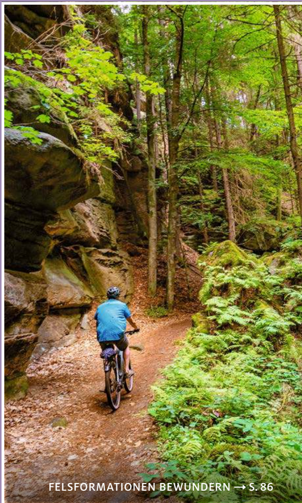
FELSFORMATIONEN BEWUNDERN → S. 86