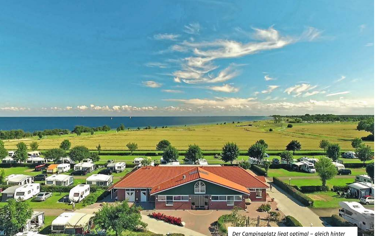
Der Campingplatz liegt optimal – gleich hinter der Liegewiese erstreckt sich das endlose Meer.