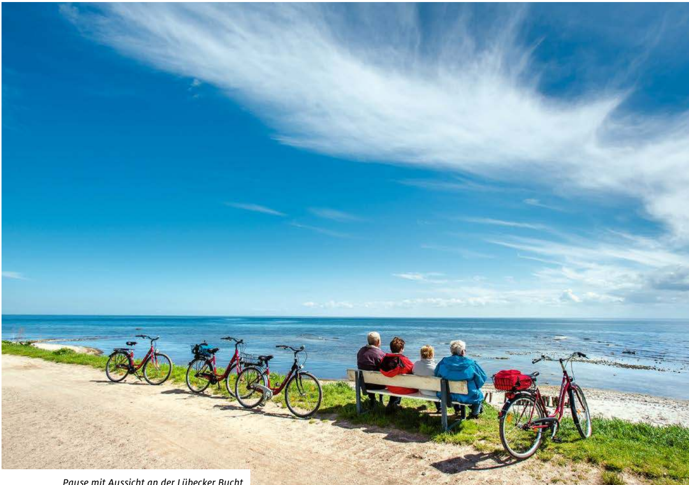
Pause mit Aussicht an der Lübecker Bucht

Und wenn das Wetter wirklich mal so ungemütlich ist, dass man keine Lust hat, draußen Rad zu fahren, gibt es zur Not noch den Fitnessraum. Dort kann man direkt am Fenster mit Blick auf die Felder strampeln. Die säumen den Camping Rosenfelder Strand von drei Seiten, strahlen mal in Leuchtstiftgelb, wenn der Raps blüht, oder golden, wenn das Getreide erntereif ist.