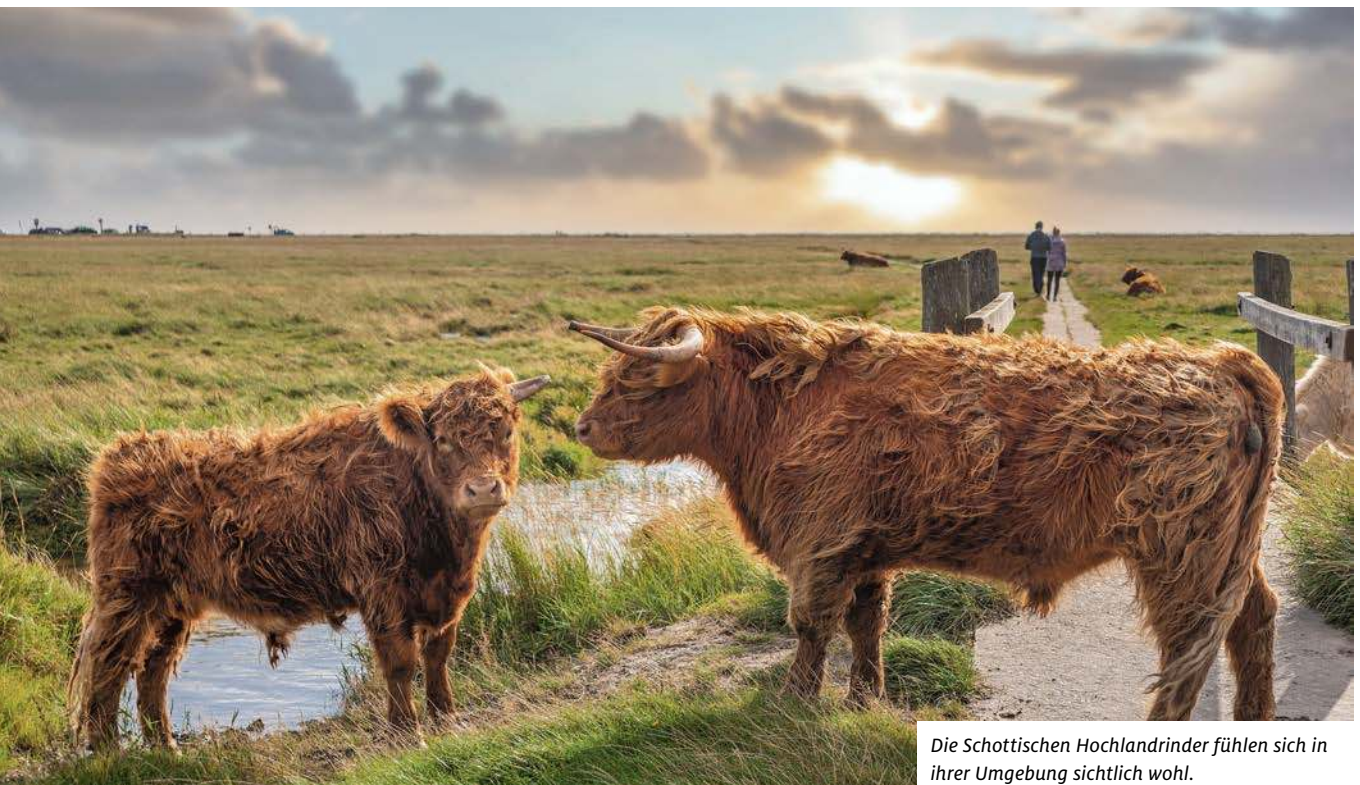
Die Schottischen Hochlandrinder fühlen sich in ihrer Umgebung sichtlich wohl.

Mit Meerluft in der Nase, der See im Blick und Badesachen im Gepäck geht es auf dem Deichversorgungsweg in den Süden. Links das Meer, rechts wechseln sich Campingplätze und freies Land ab, bis man zur Dahmer Schleuse gelangt, an der der Oldenburger Graben ins Meer mündet. Bisweilen neugierig beobachtet von Schottischen Hochlandrindern, die mit ihrem zotteligen Fell hier Wind und Wetter trotzen. Nicht ganz so leicht zu entdecken ist der »Kleine Schwede« am Nystedplatz, ein 24 Tonnen schwerer Findling, den die letzte Eiszeit aus Astrid Lindgrens Heimatstadt Vimmerby in Schweden an die Ostsee rollte. Wer mehr darüber wissen möchte, kann sich im traditionsreichen Ostseebad einer geologischen Strandwanderung anschließen ( www.dahme.com , www.wirlieben.dahme.de ). Direkt gegenüber ragt die Seebrücke ins Meer. Schiffsverkehr gibt es hier nicht mehr, dafür den einzigen Pegel, der an der deutschen