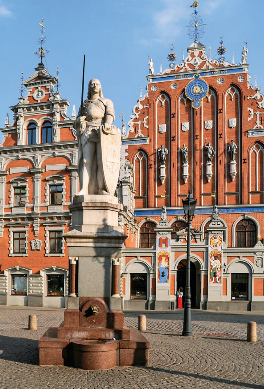
Rolandstatue und Schwarzhäupterhaus in Riga