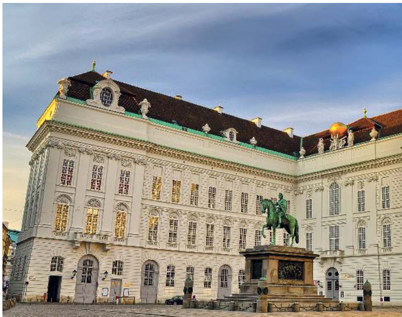
Die Wiener Hofburg war die Schaltzentrale der Habsburgermonarchie

Die Donaumetropole, einst mondänes Zentrum des Habsburgerreiches, bietet heute moderne Lebensqualität