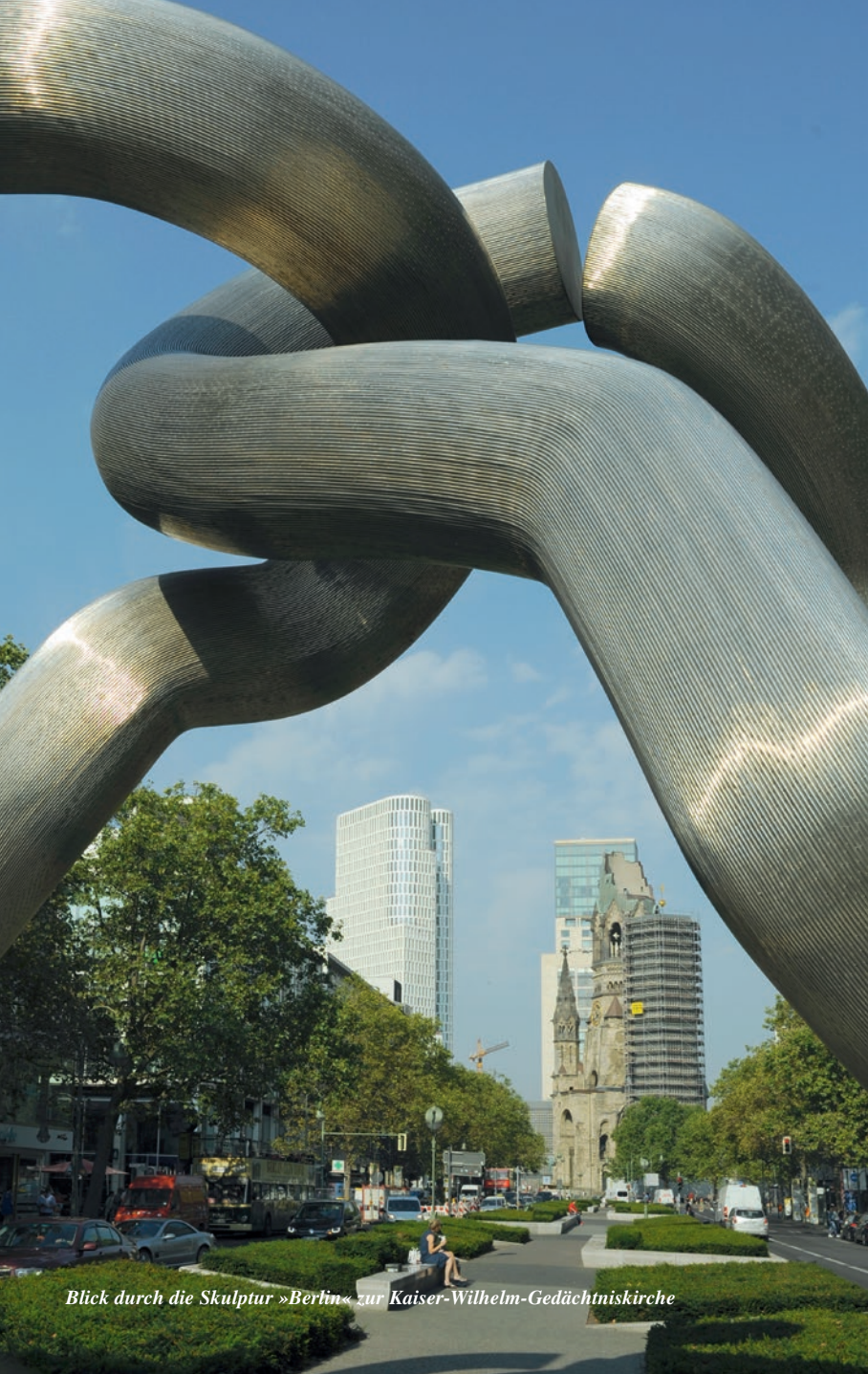
Blick durch die Skulptur »Berlin« zur Kaiser-Wilhelm-Gedächtniskirche